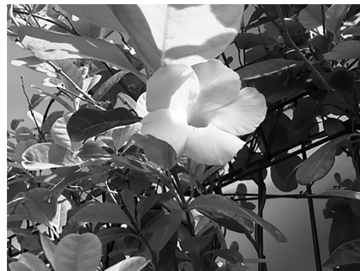
Figura 3. Pentalinon luteum .