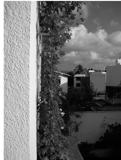
Figura 2. Detalle de la estructura.