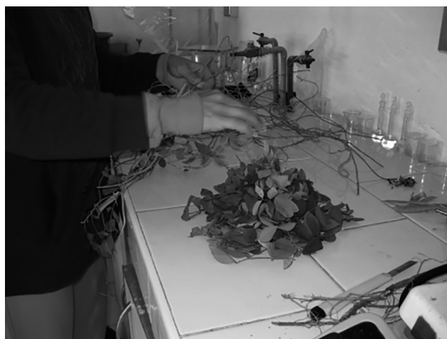
Figura 5. Separación de la planta en fracciones.

Las partículas de polvo se etiquetaron y se colocaron en bolsas de papel glassine para trasladarlas al departamento de Edafología del Instituto de Geología de la Universidad Nacional Autónoma de México (UNAM), donde se realizó el análisis por duplicado del contenido de carbono. Para ello se utilizó un analizador elemental CNHS/O perkin Elmer 2400 series II en el modo CHN.