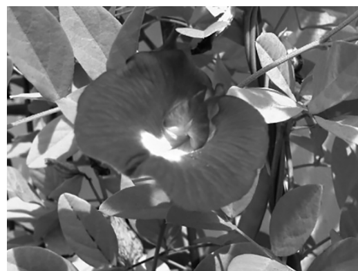
Figura 4. Clitoria ternatea .