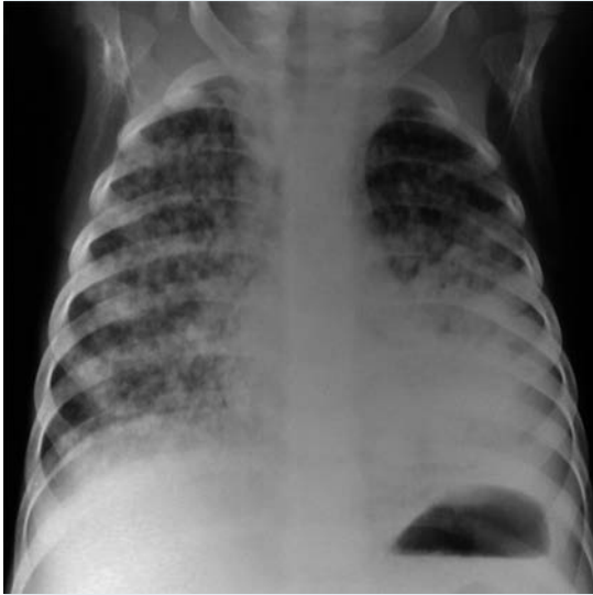
Figura 3. Radiografía de tórax de masculino de 22 meses con infección ganglionar por Mycobacterium tuberculosis , en la cual se observa infiltrado miliar bilateral. Tomado de: Artega R, Pantoja M. Tuberculosis Ganglionar y Miliar. Rev. Soc. Bol. Ped. 2002; 41 (2) bajo licencia CC BY-NC 4.0