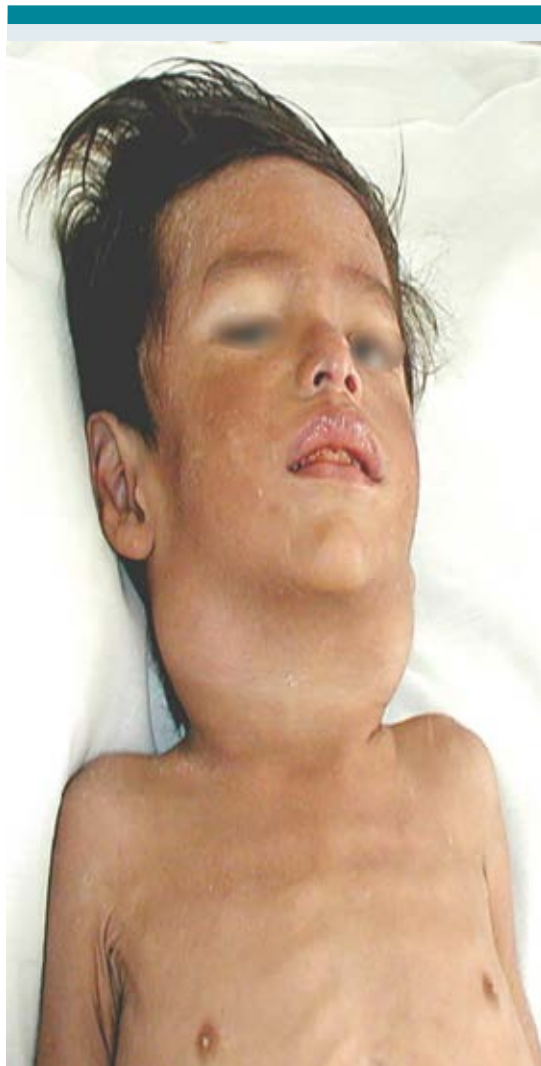
Figura 2. Masculino de 22 meses de edad con adenomegalias cervicales bilaterales por infección por Mycobacterium tuberculosis . Tomado de: Artega R, Pantoja M. Tuberculosis Ganglionar y Miliar. Rev. Soc. Bol. Ped. 2002; 41(2) bajo licencia CC BY-NC 4.0

axilar o epitroclear; sin embargo, la afectación cervical aislada se observa en 25% de los casos. Esta adenitis es causada por Bartonella henselae y su aparición va precedida de una pápula eritematosa; esta lesión aparece en casi 95% de los casos