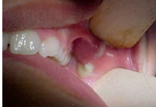
Figura 2. Salida de líquido purulento por el conducto de Stenon.

otalgia; malestar general, irritabilidad, anorexia, trismo, celulitis (edema, eritema y calor) de la piel circundante; por las carúnculas de la desembocadura del conducto puede salir espontáneamente saliva turbia o purulenta al realizar presión sobre la acumulación, por lo que el cuadro clínico recibe el nombre de sialoadenitis bacteriana aguda supurativa (Figura 2). 1,3,13,22 Usualmente, ocurren episodios inflamatorios repetitivos, separados por períodos asintomáticos y sin enfermedad sistémica acompañante, tres a cuatro veces por año, lo que hace al cuadro clínico un proceso crónico que da lugar a una sialoadenitis bacteriana crónica y recurrente. El aumento de volumen de la glándula se estabiliza con la consiguiente fibrosis del parénquima glandular que se manifiesta por una consistencia dura de carácter nodular de toda la glándula. 1,5,8 Cuando el cuadro es agudo se puede presentar de forma bilateral; en casos crónicos, casi siempre es unilateral.