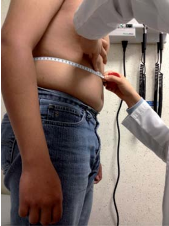
Figura 3. Medición de circunferencia de cintura.

en este sistema habrán de investigarse. En el abdomen la evaluación del hígado, sus dimensiones y la presencia o no de dolor orientan a la posibilidad de hígado graso o esteatohepatitis no alcohólica.