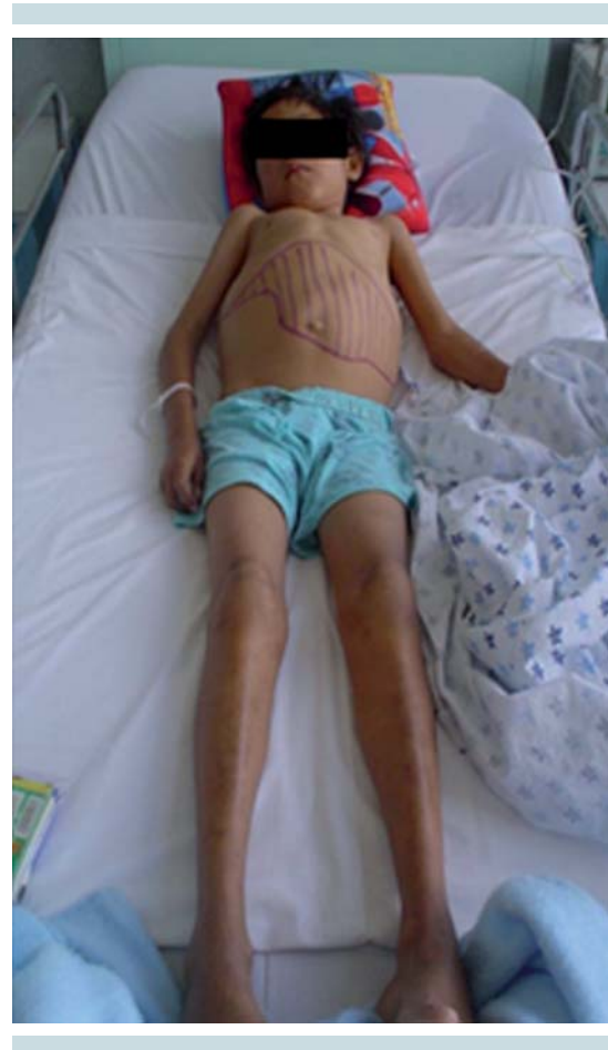
Figura 1. Paciente con ENP-B que muestra hepatoesplenomegalia.

Los tres pacientes tenían hepatoesplenomegalia, diagnosticada clínicamente y por ultrasonido abdominal (Figura 1). Dos pacientes tenían hiperesplenismo e hipertensión portal. Todos tenían elevación de transaminasas y sólo uno elevación de bilirrubinas. Se observó detención del peso y la talla. En los tres pacientes se encontró trombocitopenia; en dos, anemia, leucopenia y tiempo de coagulación prolongado (Cuadro 1). Había afección pulmonar en dos pacientes, sin manifestaciones clínicas significativas. La radiografía de tórax mostró un infiltrado micronodular difuso en ambos casos. (Figura 2) En dos pacientes había alteraciones neurológicas, caracterizadas