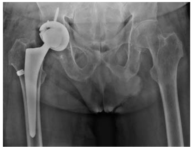
Figura 4: Radiografía postoperatoria, caso número 1.

ción de ácido homogentísico en orina 24 horas con un valor de 2,100 mg/día (valor < 10 mg/día). La Figura 6 muestra las imágenes histológicas del cartílago articular.