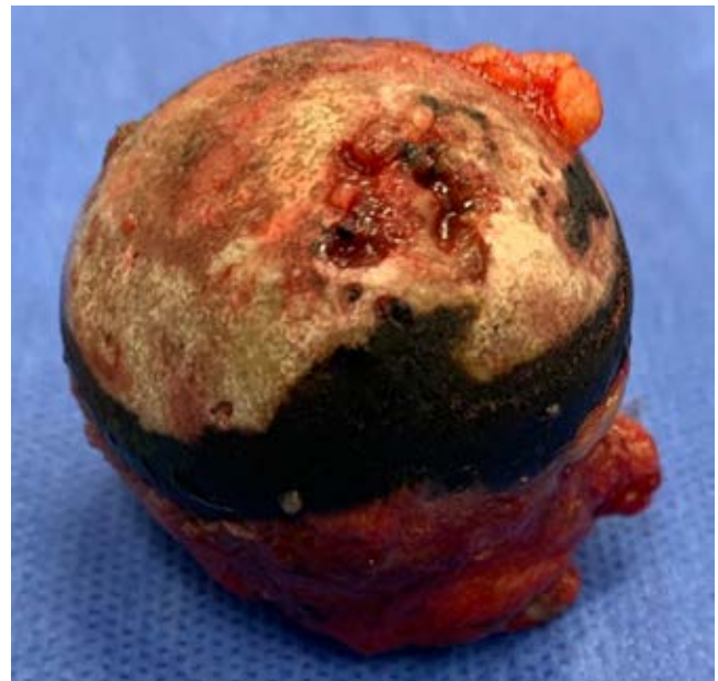
Figura 9: Cabeza femoral osteotomizada, caso número 2.

y aumenta de manera progresiva requiriendo intervención, hacia la cuarta o quinta década de la vida.