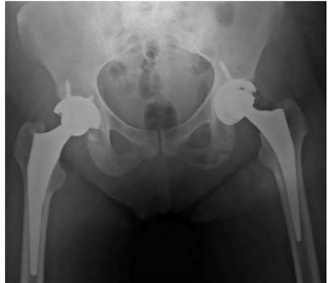
Figura 8: Radiografía postoperatoria, caso número 2.