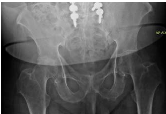
Figura 3: Radiografía preoperatoria, caso número 1.

Ante la clínica del paciente y correlacionando sus signos y síntomas, se sospechó patología de origen metabólico, por lo cual se diagnosticó alcaptonuria realizando determina-