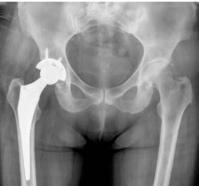
Figura 7: Radiografía preoperatoria, caso número 2.

Con relación a la sintomatología, es importante mencionar que en el metabolismo normal del hígado tiene la capacidad suficiente de producir oxidasa de HGA para convertir 1.5 kg de ácido homogentísico al día, dado lo anterior, es necesaria la pérdida de > 99% de la enzima para que un caso sea sintomático. La enfermedad comúnmente es asintomática hasta la tercera o cuarta década de la vida, en donde generalmente la alteración articular comienza a manifestarse