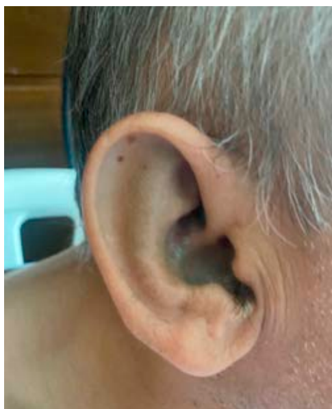
Figura 1: Ocronosis de pabellón auricular.

Debido al mecanismo de herencia, los padres de los pacientes que padecen alcaptonuria regularmente serán portadores asintomáticos, lo cual les da una probabilidad de 25% de padecer la enfermedad. Sus manifestaciones clínicas inician desde temprana edad, siendo el principal signo el cambio en la coloración de la orina, la cual al exponerse al sol se torna más oscura, asimismo están descritas manchas negras en los pañales de los infantes; sin embargo, ya que es el único signo, es difícil su diagnóstico a edad temprana. Alrededor de la tercera o cuarta década de la vida inicia su clínica más notable, evidenciándose ocronosis (coloración negra/azul del tejido conectivo) y poliartralgias, comprometiendo las articulaciones periféricas y el esqueleto axial: la columna con cambios degenerativos generando fibrosis de los discos intervertebrales, la articulación de la rodilla > 60% de los casos, el hombro en 43% de los casos y las caderas en 35% de los casos. Las pequeñas articulaciones como las manos y los pies también son afectadas, pero en menor proporción. Se ha descrito adicionalmente dado el compro-