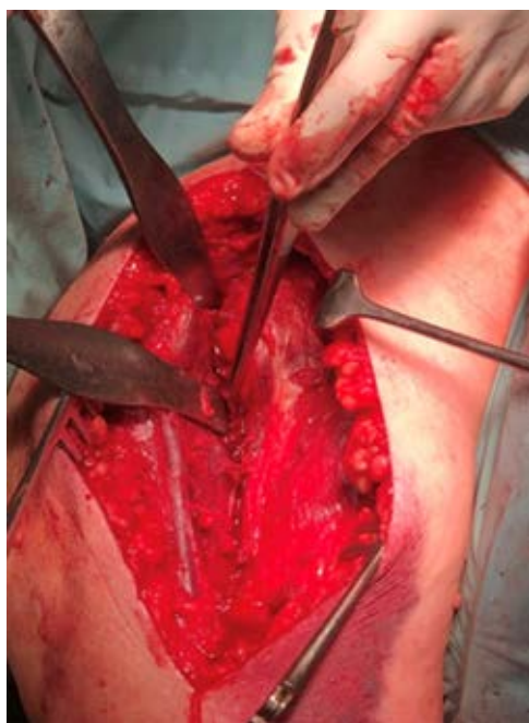
Figura 1: Abordaje deltopectoral. Se observa la vena cefálica disecada y separada hacia lateral protegida por dos separadores.

Los pacientes acudieron desde la cirugía y hasta la retirada de los agrafes dérmicos a curas ambulatorias de la herida quirúrgica cada 48 horas. El hombro intervenido permaneció inmovilizado 15 días, hasta la primera revisión en consulta; posteriormente se permitió retirada para movilización de codo y comenzar con ejercicios sencillos como movimientos pendulares. Los pacientes recibieron sucesivas revisiones al mes, dos, tres, seis meses y un año. Cuando se comprobó en dichas consultas la consolidación de tuberosidades, generalmente entre las cuatro o seis semanas, se iniciaron ejercicios pasivos de movilización y los pacientes fueron derivados al Servicio de Medicina Física y Rehabi-