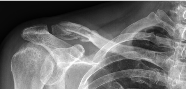
Figura 3: Aspecto radiológico de un hombre de 52 años (caso 1) con una fractura de tipo V de Neer a las cinco semanas postoperatorias.