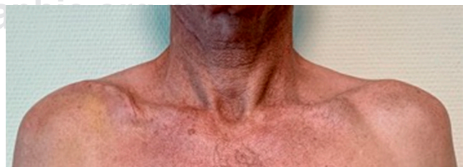
Figura 4: Aspecto clínico del caso 1 a las cinco semanas del postoperatorio. Obsérvese que ambas articulaciones acromioclaviculares están al mismo nivel.

Este trabajo presenta limitaciones: se trata de una serie de casos pequeña; el período de seguimiento es probablemente corto para evaluar las complicaciones a largo plazo derivadas de la sutura utilizada; no se dispuso de un grupo control para realizar un estudio comparativo.