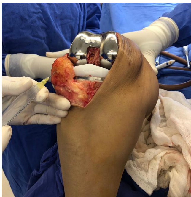
Figura 1: Técnica de infiltración periarticular.

Se dividió la solución en cinco partes de 10 ml cada una, se infiltró: