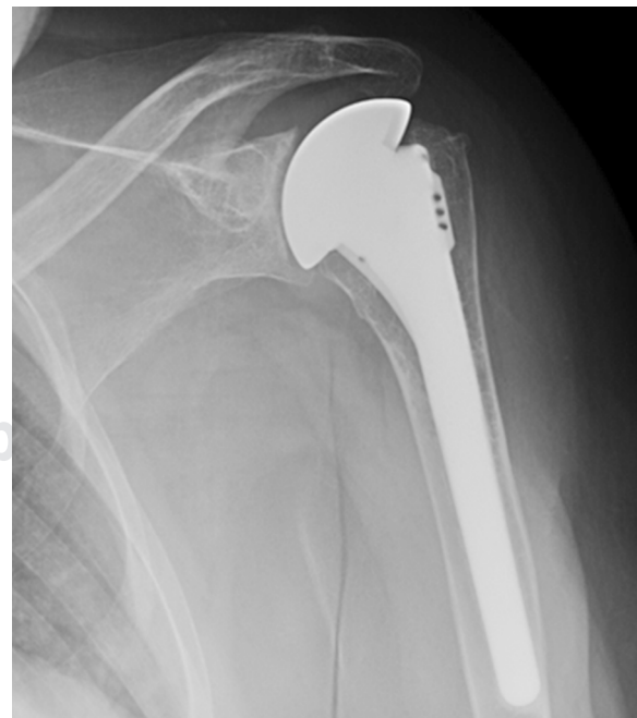
Figura 3: Radiografía AP al final del seguimiento.

Garstman y colaboradores 13 en su estudio muestran una diferencia total de 54 puntos en las prótesis anatómicas y de 42 puntos en las HA al comparar el ASES preoperatorio con el postoperatorio. Además, reconocen que no hay diferencias estadísticamente significativas al comparar HA con AT en cuanto a la función, el rango articular, la fuerza ni la puntuación total de la escala ASES, aunque sí reconocen que las puntuaciones en AT son algo superiores. En nuestro trabajo, se aprecia una diferencia de 50 puntos entre el ASES prequirúrgico con el postquirúrgico, lo que es similar a lo encontrado por este autor para sus AT. Levine y su equipo de trabajo 16 hallaron 68 puntos en la escala ASES postopera-