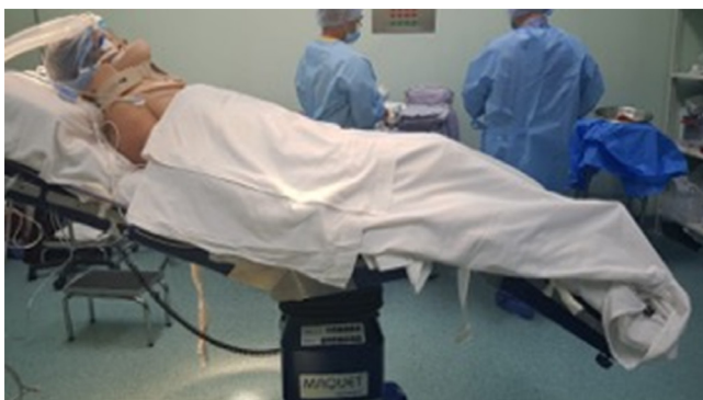
Figura 1: Posición de paciente.

A través de un portal posterior se ingresa a la articulación glenohumeral, mediante visión directa se inicia recorrido sistemático identificando lesiones estructurales asociadas que contribuyen a la inestabilidad, se corrobora pérdida