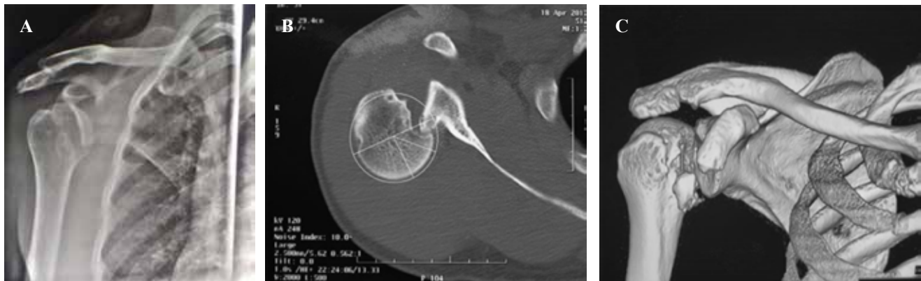
Figura 1: A) Radiografía anteroposterior verdadera de hombro, se observa incongruencia de articulación glenohumeral. B) Corte axial de tomografía simple de hombro, se observa impactación de rodete glenoideo posterior sobre la superficie anterior de cabeza humeral (< 25%). C) Reconstrucción de tomografía simple de hombro.

A las ocho semanas postquirúrgicas presenta arcos de movilidad pasivos flexión de 100°, abducción de 100°, rotación externa 15°. Se inician movimientos activos para mejoría de arcos de movilidad, después de 12 semanas de la cirugía se reevalúan arcos de movilidad activos, alcanza: flexión 170° abducción 170°, rotación externa 45°, rotación interna S1, extensión 30°. A los 13 meses de seguimiento alcanza flexión