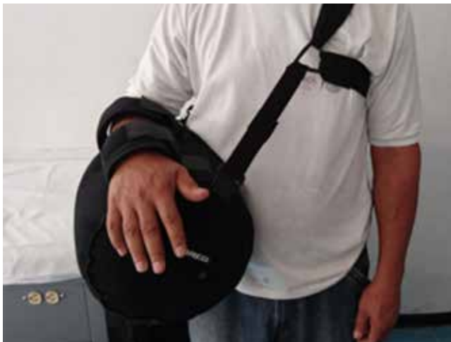
Figura 4: Aparato abductor empleado en la rehabilitación del paciente durante seis semanas.

de 180°, abducción 180°, rotación interna alcanza el nivel de T12, rotación externa de 70° (Figura 5), con un puntaje de Constant Score de 98 sobre 100 (dolor 25; actividades cotidianas 20; arcos de movilidad 38; fuerza 25) (Tabla 1).