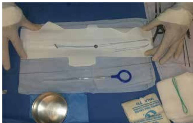
Figura 1: Sistema de anclaje de doble botón.

En nuestro hospital, según cifras del Sistema de Información Médico Operativo (SIMO) del Instituto Mexicano del Seguro Social, año 2016, la luxación de hombro tuvo una tasa de incidencia de 57.42 casos/10,000 egresos hospitalarios, así la luxación acromioclavicular grado III, IV, V y VI fue de 11.15/1,000 pacientes hospitalizados; se desconocen los tiempos de incapacidad laboral y de incorporación de los trabajadores a sus actividades. También se utilizan otras técnicas quirúrgicas para su manejo, como la técnica de Mumford, en la que se hace una resección distal de la clavícula con resultados no satisfactorios, por lo que se decidió realizar este es-