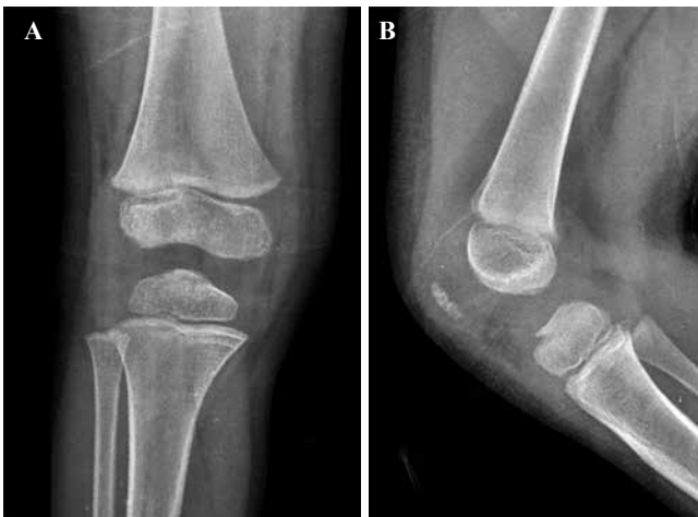
Figura 2: Radiografías a los dos meses de evolución.

lor y realizando actividad normal, siendo dado de alta a los dos meses con las radiografías de la Figura 2 , en las que se aprecia consolidación de la fractura, aunque persiste un ligero desplazamiento superior de la zona anterior de la espina.