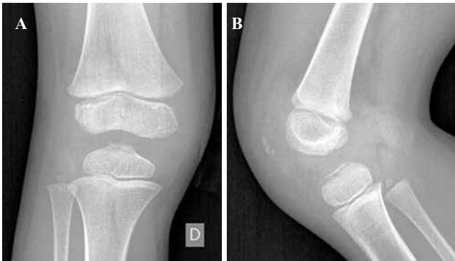
Figura 1: Radiografías iniciales a los cuatro años.