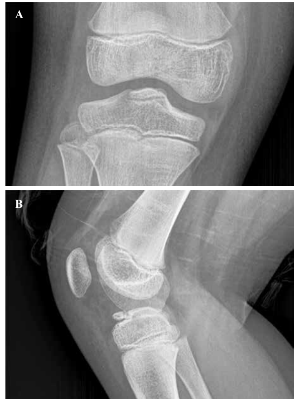
Figura 3: Radiografías a los siete años.

Se realizó una artroscopia mediante portales estándar anteromedial y anterolateral, en la que se visualizó la interposición del ligamento intermeniscal en el foco de pseudoartrosis y se descartó cualquier otra lesión intraarticular asociada. Se retiró el tejido interpuesto y se realizó un desbridamiento de todo el tejido fibroso del foco de fractura en pseudoartrosis hasta obtener una superficie sangrante. Se utilizó una guía de posicionamiento tibial para plástia de LCA, insertada por el portal anteromedial para presionar hacia abajo la parte anterior de la espina