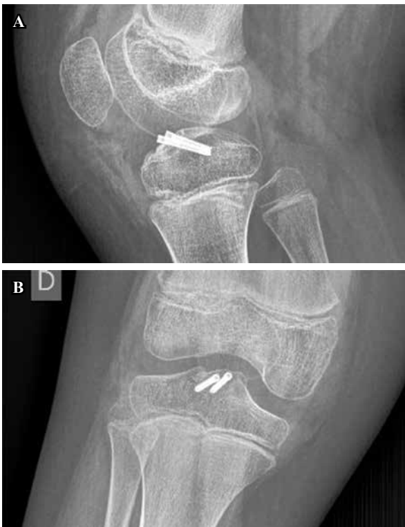
Figura 5: Radiografías de control en postoperatorio inmediato.