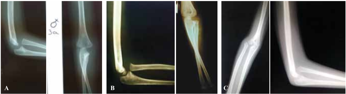
Figura 2: Caso 1. Radiografía en proyección AP y lateral de codo derecho, edad de tres años (A). Radiografía de codo derecho en proyección AP y lateral, edad de cuatro años (B). Radiografías en proyección AP y Lateral de codo derecho a la edad de nueve años (C).