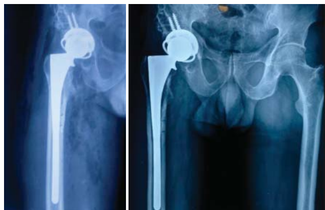
Figura 2: Radiografías postoperatorias inmediatas.

no cementado (Reach, Biomet®), con copa primaria no cementada (Mallory Head, Biomet®), liner constreñido (Freedom®) y cabeza de 36 mm ( Figura 2 ).