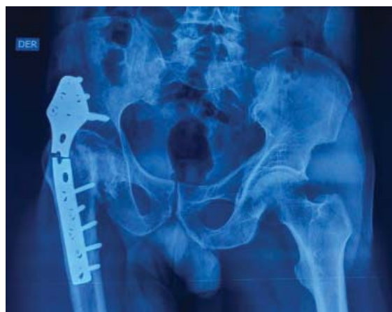
Figura 1: Radiografías preoperatorias.

Masculino de 61 años de edad, campesino, antecedente de fractura de cadera derecha de 20 años de evolución, se complicó con necrosis femoral proximal, tratado en 1994 con artrodesis de cadera con placa tipo Cobra ( Figura 1 ), evolucionando con coxalgia derecha y dificultad para actividades de la vida cotidiana, acortamiento de miembro pélvico de 4 cm, con un resultado de Harris de 43, con marcha Trendelenburg, uso de apoyos técnicos, con arcos de movilidad limitados. Se tomaron radiografías y tomografía axial computarizada (TAC) simple de pelvis, en las que se observó defecto acetabular Paprosky I. Se realizó cirugía el 06 de Septiembre de 2016 con conversión de artrodesis de cadera derecha a prótesis total primaria con abordaje lateral directo, retiro de material de osteosíntesis, vástago cilíndrico, con recubrimiento poroso extenso de apoyo diafisario