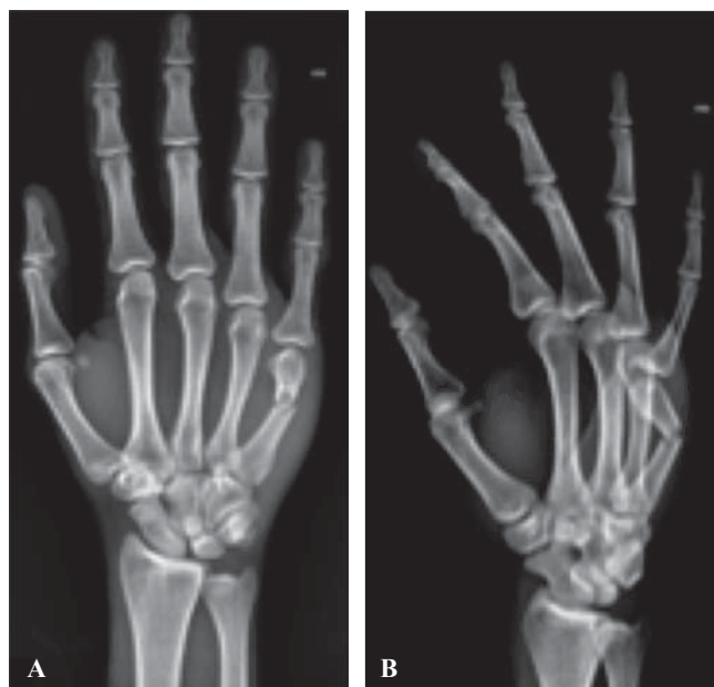
Figura 1. A. Radiografías AP y B. Oblicua de mano derecha.

Se trataron 10 pacientes de Octubre de 2015 a Octubre de 2016 con once fracturas de metacarpianos: nueve fracturas de cuello de quinto metacarpiano, una de cuello de cuarto metacarpiano y una de diáfisis de quinto metacarpiano. El promedio de edad de los pacientes fue de 30 años. Ocho pacientes se fracturaron con una contusión directa y carga axial durante un golpe. Una paciente sufrió fractura del quinto metacarpiano durante un accidente automovilístico.