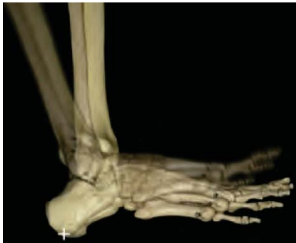
Figura 1. Primer rocker: choque de talón.