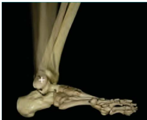
Figura 2. Segundo rocker: apoyo.