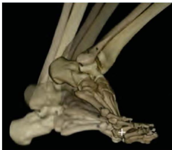
Figura 3. Tercer rocker: propulsión.