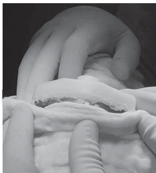
Figura 3. Cementado del nuevo inserto de polietileno al componente tibial.