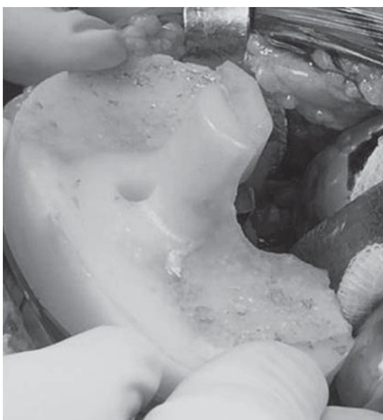
Figura 2. Inserto de polietileno original con desgaste de predominio posterior.