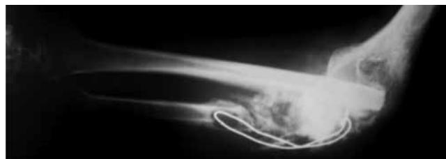
Figura 2. Radiografía AP de antebrazo al ingreso.