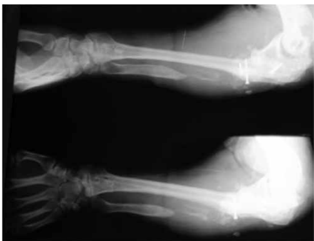
Figura 4. Radiografías postoperatorias del retiro del clavo centromedular donde se observa integración de la formación de un solo hueso.

antebrazo con flexoextensión de codo y muñeca completas con fuerza muscular adecuada para continuar labores de la vida diaria, actualmente integrado en su trabajo de campo sin limitaciones funcionales.