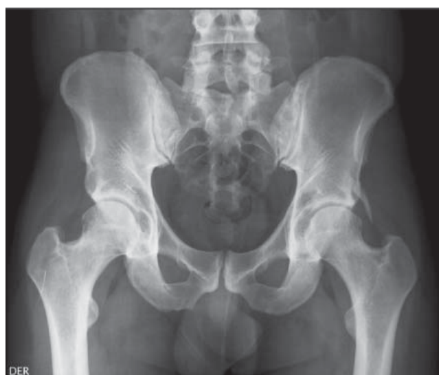
Figura 1. Radiografía de pelvis anteroposterior.

El pinzamiento femoroacetabular es una patología de reciente caracterización. En la actualidad está bien definido el pinzamiento entre la interfaz cabeza-cuello femoral y el reborde acetabular. Por otra parte, las causas de pinzamiento de cadera extraarticular se están describiendo con mayor frecuencia, siendo de muy reciente descripción la causada por espina ilíaca anteroinferior. Se describe como evento causal de deformidad de EIAI una avulsión previa o una osteotomía. 3 En este caso en particular, existe el antecedente de cuadros clínicos similares desde temprana edad, lo que