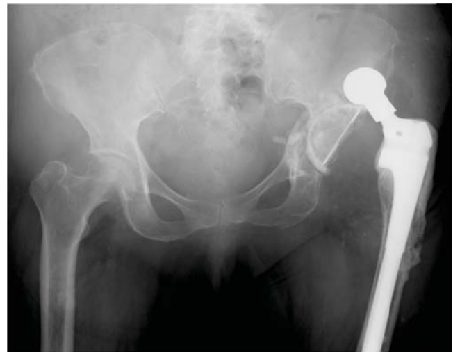
Figura 2. Radiografía anteroposterior de la pelvis con luxación posterior de artroplastía total de cadera.

El diagnóstico de una luxación de cadera es relativamente sencillo de realizar, ya que el cuadro clínico es muy típico.