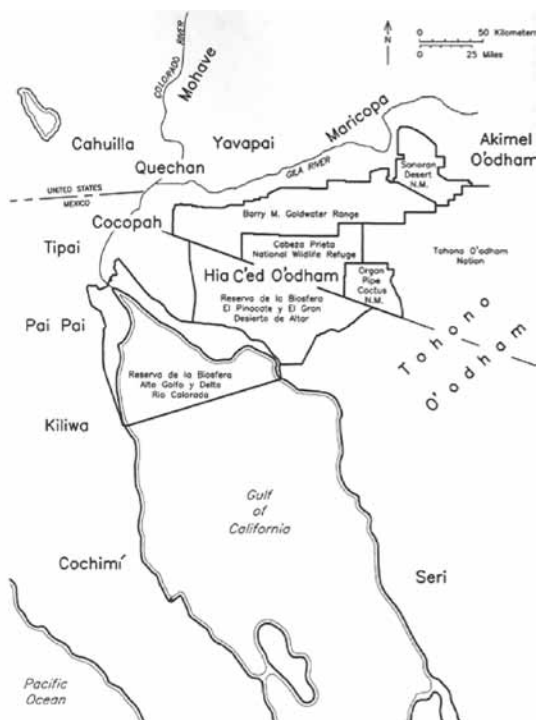
MAPA 1. LOS GRUPOS ODHAM EN EL DESIERTO DE ALTAR-YUMA

adverso (Aguilar Zeleny, 2005). Desde hace siglos los Odam han vivido, en pequeños asentamientos, en el desierto de Altar (Ortiz Garay, 1995: 219-290; Neyra Solís, 2007: 1-50; Aguilar Zeleny, 1998: 7-10). El territorio tradicional del grupo étnico se extendía desde el centro de Sonora y llegaba hasta el suroeste de Arizona, en EUA (Nolasco, 1965: 375-448; Basauri, 1990: 155-166; Salas Quitanal et al. , 2004: 8-12). Los Odam eran un pueblo compuesto de tres tribus diferentes: los Akimel Odam , los Hia'ched Odam y los Tohono Odam (ver mapa 1).