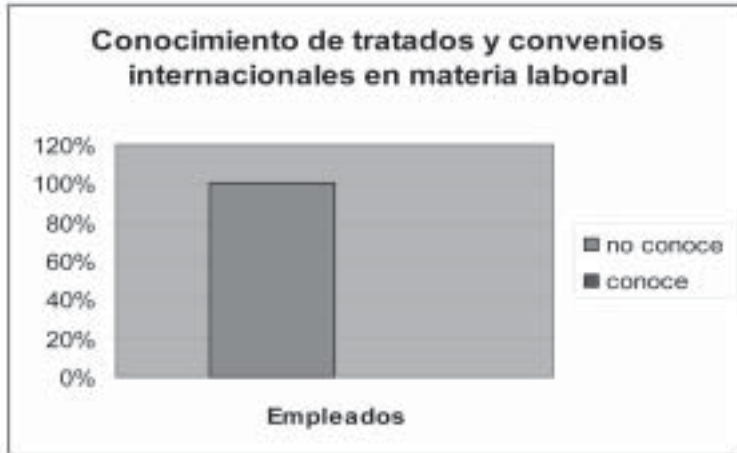
GRÁFICA 3. ¿CONOCE USTED ALGÚN CONVENIO O TRATADO INTERNACIONAL FIRMADO POR MÉXICO EN MATERIA LABORAL?

Véase el apartado "Metodología", supra , pp. 164-166.