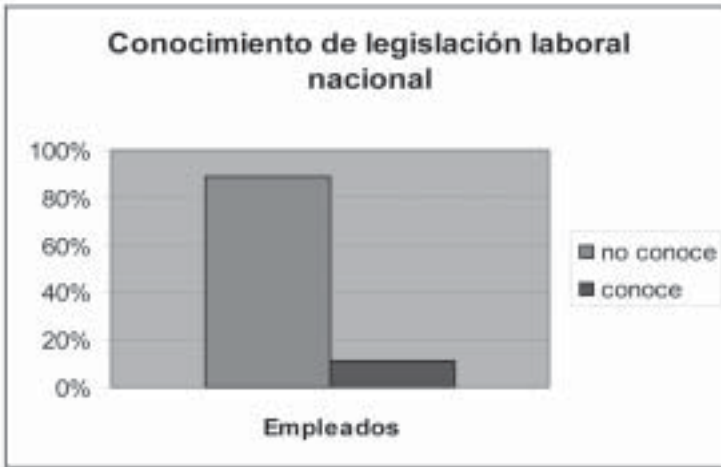
GRÁFICA 4. ¿CONOCE USTED ALGUNA LEY O NORMA LABORAL MEXICANA?

Véase el apartado “Metodología”, supra , pp. 164-166.