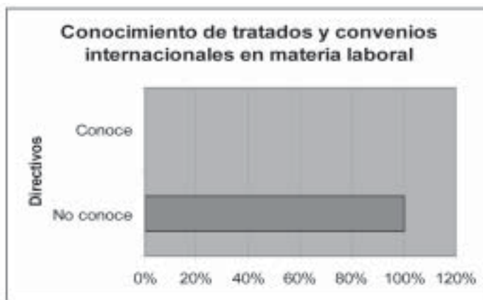
GRÁFICA 1. ¿CONOCE USTED ALGÚN CONVENIO O TRATADO INTERNACIONAL FIRMADO POR MÉXICO EN MATERIA LABORAL?

Véase el apartado "Metodología", supra , pp. 164-166.