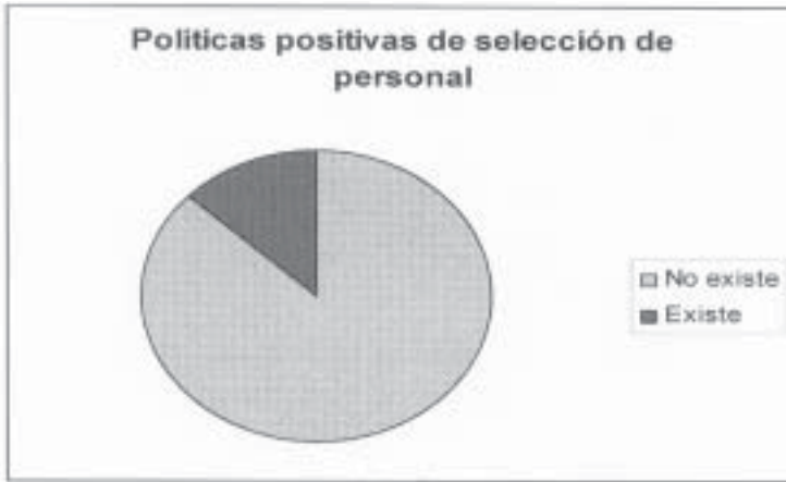
GRÁFICA 6. ¿EN CASO DE IGUALDAD DE CONDICIONES, SE ELIGE A UNA MUJER FRENTE A UN HOMBRE PARA RECLUTAR PERSONAL?

Véase el apartado "Metodología", supra , pp. 164-166.