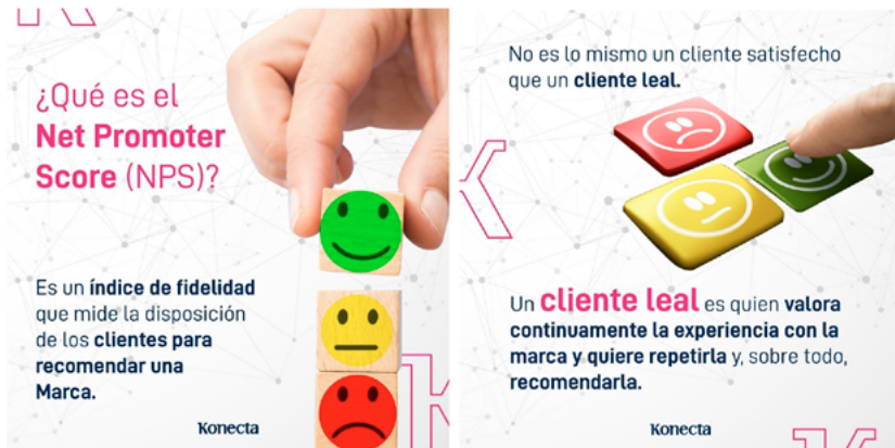
Ilustración 3. konectaargentina. (2021-09-06). Instagram . Recuperado el 08 de 09 de 2021, de https://www.instagram.com/p/CTfWBBrlxtQ/

Las empresas privadas son conscientes de la importancia del pensamiento social, en este sentido, reconocen que la recomendación “boca a boca” de sus productos es de capital importancia a la hora de conseguir nuevos clientes. Es decir, la recomendación de un familiar o allegado tiene más peso que una publicidad en televisión a la hora de influir en la elección de un individuo. En este sentido, una de las formas más utilizadas para medir el éxito y la proyección de un producto en el mercado es a través del Net Promotore Score . 4 Tal como puede verse en la ilustración 3, este índice releva tanto la satisfacción del cliente con el producto en cuestión, así como su disposición a recomendarlo. Con este indicador, el call center mide tanto la destreza en