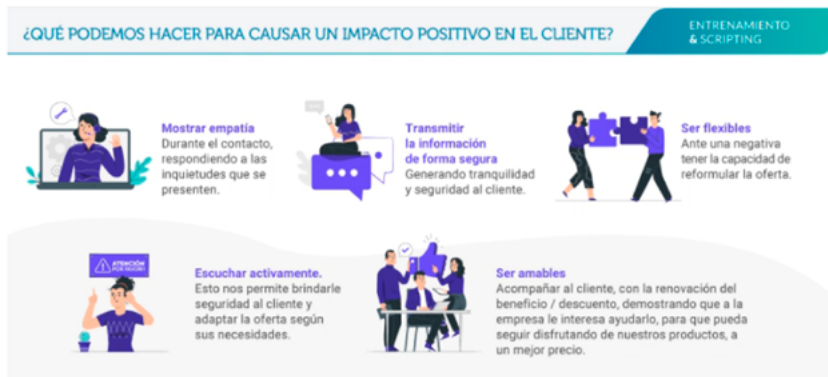
Ilustración 1. Manual de atención al cliente provisto en el marco de una entrevista con empleado de Konecta, sucursal Córdoba, Argentina.

Podemos tomar como ejemplo de lo antedicho los manuales que provistos por Konecta en Argentina. Las sugerencias que observamos en las imágenes 1 y 2 se orientan a brindar habilidades blandas a los trabajadores con el objetivo persuadir al cliente por medio del manejo de las emociones.