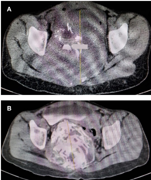
Figura 2: Imágenes de tomografía computarizada en cortes axiales, con seis meses de diferencia, mostrando tumor de células gigantes en sacro. A) Tamaño (452.9 mm) al inicio del tratamiento. B) Reducción de volumen tumoral a 98.7 mm después de seis meses de manejo con denosumab.

estudio de imagen de control mostró reducción de tamaño tumoral, de inicialmente 452 mm, a 98.7 mm (Figura 2).