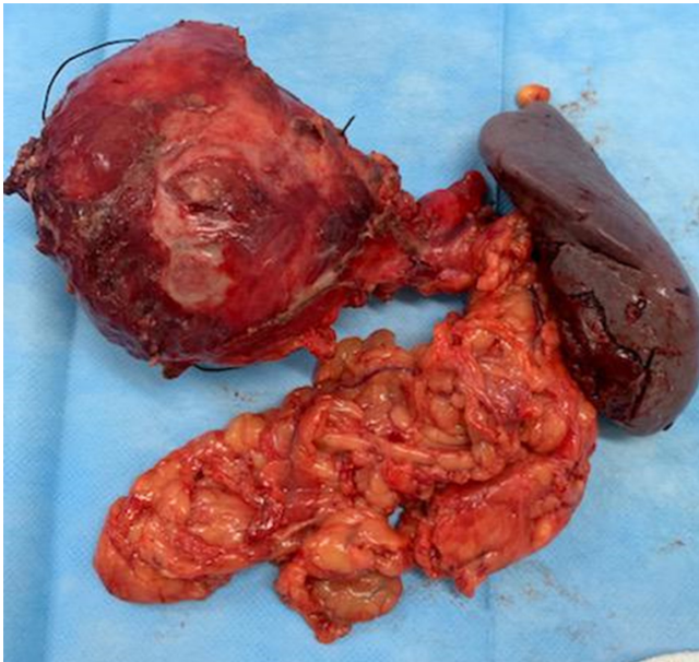
Figura 1: Pieza quirúrgica producto de la resección. Se observa páncreas distal con presencia de una tumoración en uno de sus extremos, así como un fragmento de hígado.

El término anafilaxia no alérgica o no inmunomediada describe la misma clínica, pero el mecanismo no está mediado por anticuerpos, es el resultado de la liberación directa y no específica de mediadores vasoactivos y proinflamatorios al torrente circulatorio. 1