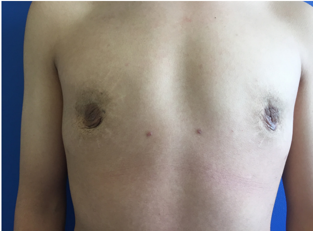
Figura 2: Fotografía postoperatoria en la que se observa corrección del volumen mamario, con adecuada retracción cutánea y viabilidad de complejos areola-pezones.

En la actualidad, el sujeto se encuentra con adecuada evolución sin evidencia de crecimiento de tejido mamario glandular ni grasa, así como una adecuada cicatrización y sin evidencia de anillo de constricción de mama tuberosa, presentando resultado estético satisfactorio (Figura 2).