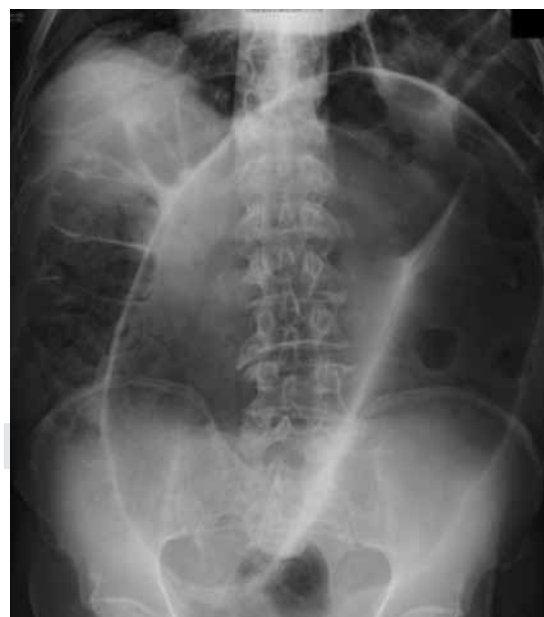
Figura 3: Imagen en grano de café, característica de vólvulo de sigmoides.

En casos que ameritan manejo quirúrgico urgente existen dos opciones: procedimiento de Hartmann (sigmoidectomía más colostomía terminal) y sigmoidectomía con anastomosis colorrectal con o sin ileostomía de protección. 11 El procedimiento de Hartmann está indicado en