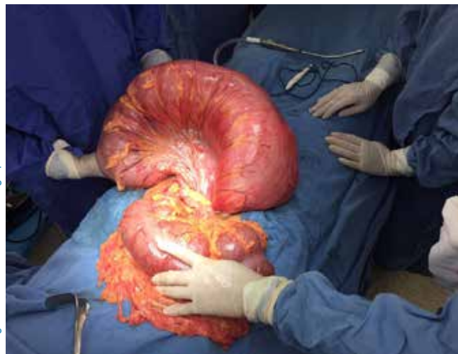
Figura 1: Vólvulo de sigmoides.

En 90% de los pacientes se presentó cuadro clínico de obstrucción intestinal, de los cuales 77.77% manifestó datos de irritación peritoneal (signo de Blumberg positivo) (Figura 2).