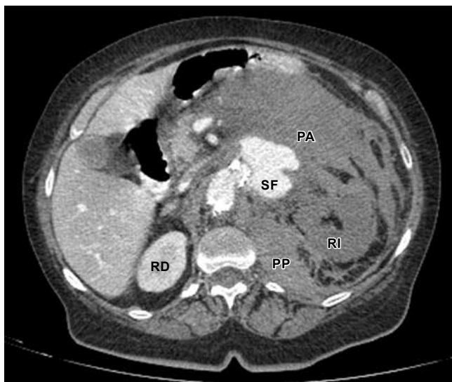
Figura 2: Corte axial de la tomografía que muestra el sitio de fuga (SF) hacia el retroperitoneo; se aprecia ocupación del espacio pararenal anterior (PA) y posterior (PP) por el hematoma contenido. Riñón izquierdo (RI) congestivo, hipoperfundido y sin reforzamiento durante las fases contrastadas, comparado con el riñón contralateral (RD).

El aneurisma de la aorta abdominal se define como una dilatación aórtica persistente 1.5 veces mayor que su diámetro normal; un diámetro aórtico mayor de tres centímetros se considera aneurismático. Ocurre con una media de edad entre los 70 y 75 años; predomina en el sexo masculino, con una prevalencia en autopsias de 1.8-6.5%. Su etiología se debe a la degradación proteolítica de las proteínas de la matriz extracelular (colágeno y elastina) secundaria en 95% de los casos a la presencia de aterosclerosis; los restantes están producidos por traumatismos, vasculitis e infecciones. Tiene como factores de riesgo el tabaquismo, la hipertensión, la hipercolesterolemia y antecedentes familiares. La ecografía resulta útil para la detección y la evaluación seriada; sin embargo, la tomografía simple y contrastada supera al ultrasonido en la detección del paciente sintomático y es de mejor utilidad para la valoración preoperatoria. Es de vital importancia la extensión aneurismática a las arterias renales