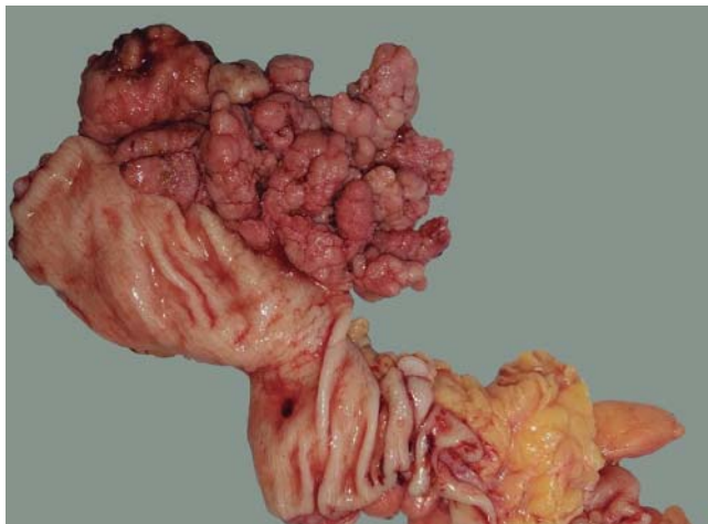
Figura 2: Producto de hemicolectomía izquierda con diagnóstico patológico de adenocarcinoma bien diferenciado, polipoide ulcerado.

Un pólipo hiperplásico es común y presenta mutación en KRAS o BRAF; el potencial maligno de estas lesiones es muy bajo. 16