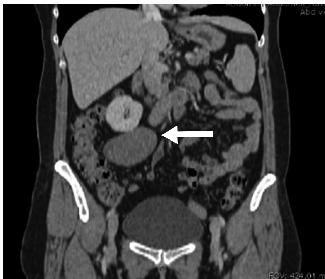
Figura 1: Tomografía de abdomen que demuestra tumor retroperitoneal derecho adherido a vena cava inferior.

El ganglioneuroma como diagnóstico diferencial de una masa retroperitoneal debe permanecer patente. 4,5 Su