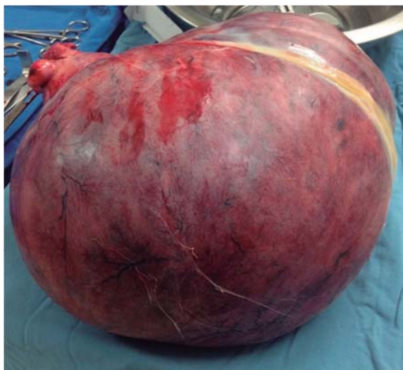
Figura 2. Pieza quirúrgica obtenida posterior a laparotomía exploradora. Nótase el incremento de tamaño del útero respecto de sus dimensiones normales.

El diagnóstico histopatológico fue miomatosis uterina con degeneración hialina. La paciente egresó cinco días posteriores a evento quirúrgico sin complicaciones postoperatorias en el seguimiento en consulta externa.