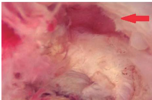
Figura 2. Imagen histeroscópica que evidencia saculación a nivel del istmo uterino.