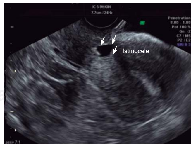
Figura 1. Ultrasonido ginecológico donde se muestra a nivel del istmo uterino colección triangular econegativa.

La prevalencia de istmoceles sintomáticos reportados en la literatura oscila entre 19.4 y 84%. 7 Los posibles factores de riesgo incluyen el número de cesáreas, la posición uterina, el trabajo de parto antes de la cesárea y la técnica quirúrgica utilizada para cerrar la incisión uterina. El cierre uterino de una sola capa produce más tensión en los tejidos en comparación con la técnica de doble capa. El sangrado postmenstrual es el síntoma más típico y molesto, y se caracteriza por la descarga de material hemático oscuro recogido en la bolsa de la cicatriz durante los días después de la menstruación. La presencia de istmocele puede ralentizar el drenaje de la sangre menstrual a través del cuello uterino y facilitar su