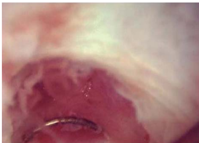
Figura 3. Imagen histeroscópica donde se observa istmoplastia con resectoscopio.

acumulación en la bolsa porque la presencia de cicatrices reduce la contractilidad del útero en esa zona. 8-10 Alternativamente, la sangre puede originarse in situ a partir del estroma 8 junto con la secreción de tipo moco, causada por una vascularización anormal alrededor de la cicatriz. Sea cual sea la fuente de la sangre, su presencia puede contribuir no sólo a sangrado postmenstrual, sino también a la infertilidad secundaria por afectar negativamente el moco y la calidad del esperma e interferir con la implantación de embriones. 11