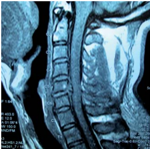
Figura 2. Imagen en corte sagital de columna cervical en RMN ponderada en T1, mostrando compresión anterior del saco dural a nivel de C5-C6 por hernia discal postraumática, con ruptura del ligamento vertebral común posterior.