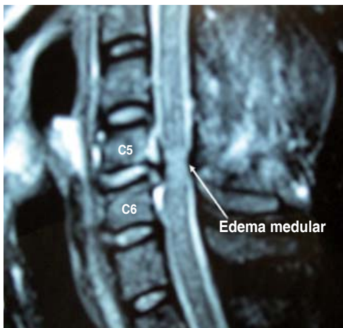
Figura 3. Imagen en corte sagital de columna cervical en RM, ponderada en T2, mostrando edema medular.