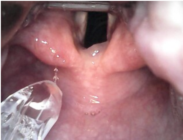
Figura 6. Visualización de estructuras orofaríngeas y laríngeas

tubo traqueal. Pero utilizando una guía sobre el interior del tubo traqueal se logra compensar esta deficiencia. Se requiere que el paciente abra la boca en por lo menos tres centímetros. (Figura. 6,7,8).