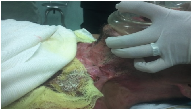
Figura 10. Paciente con bridas de cuello Por quemaduras.