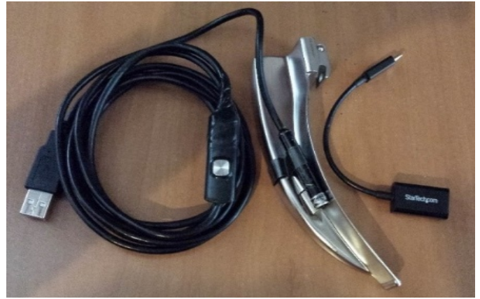
Figura 3. Cámara con cable de USB y adaptador micro USB

Zacatecas, designando el proyecto a un estudiante Ingeniero Miguel Ángel Razo Salas, quien finalmente pudo establecer la comunicación de imágenes entre la cámara y el teléfono celular ( Samsung Galaxy S4 ), (Figura 4). (Actualmente existen varias aplicaciones gratuitas para sistemas Android , usb , WebCam era , Dashcam , Cámara Fi etc.)