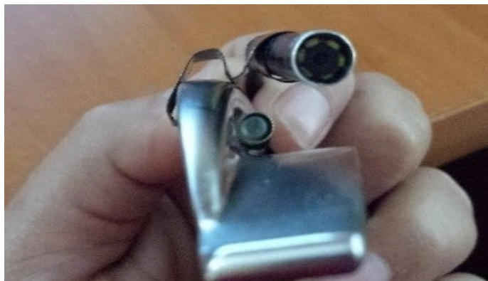
Figura 1. Colocación de Cámara mediante el broche adaptador