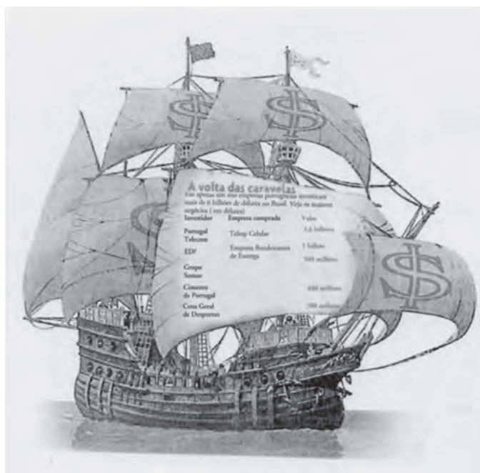
Figura 2 El regreso de las carabelas

entre ambos, y 3) en particular, las coherencias, contradicciones y ambigüedades que guían las acciones e interacciones de los líderes en la diáspora en su intermediación transnacional entre países de origen y recepción, así como en sus relaciones intra e interétnicas en las naciones de acogida.