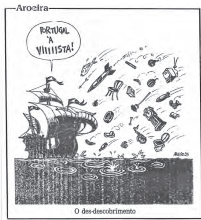
Figura 1 Drama familiar

New Bedford y São Paulo y las más recientes migraciones de brasileños a Lisboa. 7 Si al principio mi investigación en New Bedford había focalizado las aparentes paradojas desencadenadas por el drama de la violación en banda y la construcción de la saudade en una ciudad americana y sus desdoblamiento, la contrastación lusobrasileña estuvo basada operativamente en otros dos sucesos. Con uno de ellos busqué descifrar las paradojas y contradicciones de las relaciones lusobrasileñas centrándome en la eclosión de conflictos diplomáticos entre Portugal y Brasil en 1993, cuando brasileños de los estratos socioeconómicos más bajos, junto con ciudadanos de los Países Africanos de Lengua Oficial Portuguesa (PALOP), comenzaron a ser detenidos en el aeropuerto de Lisboa por el Servicio de Extranjeros y Fronteras (SEF). Esta situación, que trajo a la luz reinterpretaciones de la dupla historia colonial y de inmigración portuguesa en Brasil, fue representada como un drama familiar por los medios brasileños, según puede apreciarse en la figura 1.