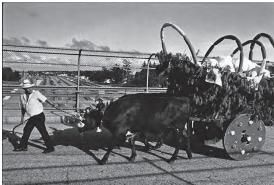
Foto 2. Fiesta del Divino Espíritu Santo

Estas metáforas de la portugalidad parecían marcar fronteras simbólicas alrededor de los enclaves étnicos esparcidos por las ciudades de Nueva Inglaterra. En aquella coyuntura histórica de renovación de los contingentes migratorios de las Azores y el Portugal continental en la ciudad y en la región –simultá-