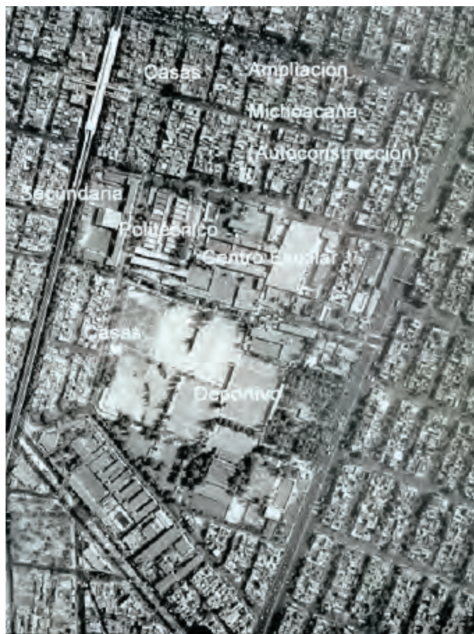
Figura 3 Fotografía aérea 1999

Fuente: Instituto Nacional de Estadística, Geografía e Informática, 1999. Fotografía aérea 1999, zona oriente de la Ciudad de México.