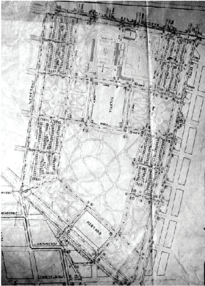
Figura 1 Plano de la colonia Michoacana

Fuente: Departamento del Distrito Federal, 1935. Dirección de Obras Públicas, Oficina de Planeación, Plano de conjunto de casas para obreros en terrenos de La Vaquita , 1 plano.