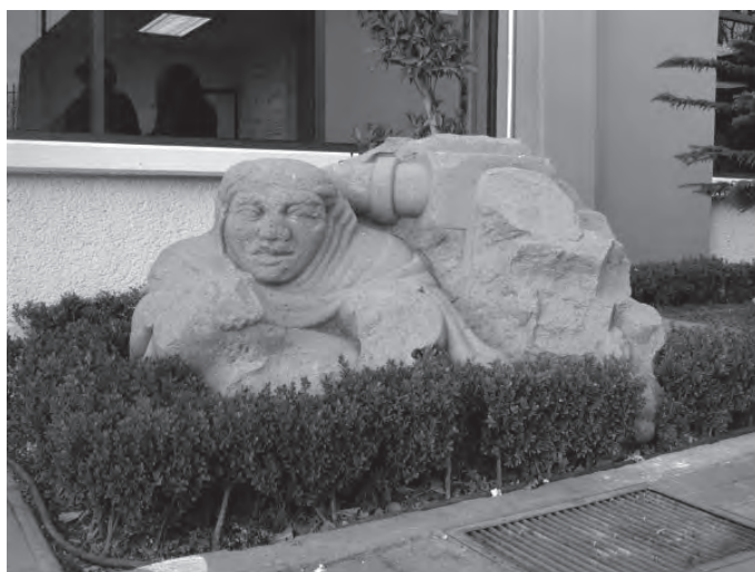
Fotografía de Claudia Zamorano, junio de 2004.

El Monolito es ahora un bloque de piedra de cerca de dos metros cúbicos en el que se dibuja un busto femenino con rasgos indígenas y, podemos suponer, ataviado con un rebozo. En la parte trasera se distingue el fragmento de un oleoducto y se puede ver que varias piezas le han sido arrancadas. Se encuentra frente al edificio central de la escuela, cerca del área administrativa, sin zoclo alguno, pero en un pequeño jardín rodeado de arbustos relativamente bien cortados. En la convivencia con los estudiantes y trabajadores durante la preparación de la exposición, me di cuenta de que se había convertido en un hito espacial, lugar de citas, punto de referencia: “nos vemos en El Monolito”; “allá frente a El Monolito”. Incluso