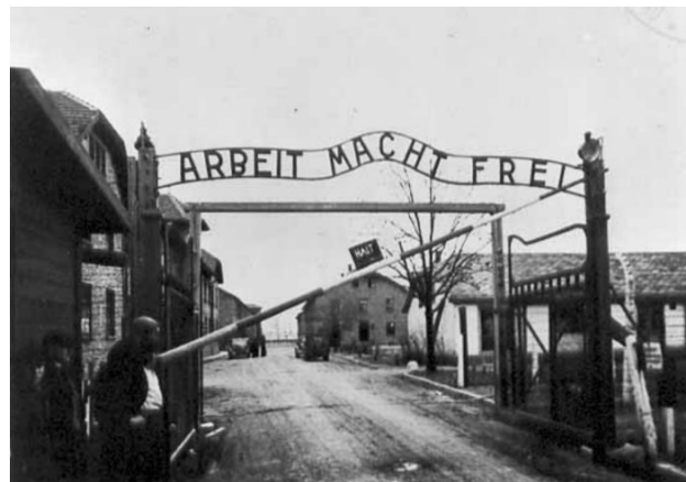
Entrada al campo de concentración Auschwitz

Con el inicio de la Segunda Guerra Mundial y la expansión del poder alemán, empezaron a hacerse efectivos los experimentos y la reordenación de los habitantes de Alemania y los países satélites. Esto se tradujo en deportaciones, procesos de clasificación de la población que esperaba en filas interminables durante largas horas, viajes mortales en los que se les amontonaba en vagones de carga para animales, 15 duchas frías a las entradas de los campos, vejaciones y humillaciones, violencia física, malos tratos, violaciones, etcétera, convertidas en lo que caracterizó la vida cotidiana de las víctimas de la estética del horror. De esta forma, cuando el otro ha sido equiparado a un animal –como se refleja en que se usaran vagones de carga para transportarlos–, sólo quedaba aprovechar a quienes se pensó podían llegar a producir, es decir, aquellas personas de las que el régimen podía sacar algún provecho. El viaje servía como espacio propicio para la selección natural: ¿cuáles eran los cuerpos que podían resistir el hacinamiento inhumano en el vagón, el dolor en todas las partes del cuerpo, el hecho de no beber ni comer? A su llegada, esos cuerpos que habían logrado sobrevivir eran otra vez seleccionados. A quienes morían con rapidez se les arrancaban las piezas ortopédicas y los dientes de oro, mismos que eran entregados a las autoridades del campo. 16