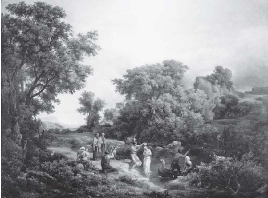
3. Károly Markó, El bautismo de Jesucristo , 1854, óleo sobre tela, con marco: 79 × 97.6 cm; sin marco: 53.7 × 71.8 cm, ciudad de México, Museo Nacional de San Carlos, inv. 54II. Reproducción autorizada por el Instituto Nacional de Bellas Artes.

(fig. 3); 43 todas estas obras se encuentran —con breves interrupciones— en la exposición permanente del Museo Nacional de San Carlos. Ahora El bautismo de Jesucristo 44 está cubierto de craqueladuras y cuatro grietas siguen la línea del bastidor; las últimas se notan también en La transgresión de la ley . 45 Las telas