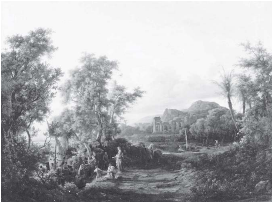
13. Károly Markó, La vocación de san Pedro , 1856, óleo sobre tela, con marco: 143 × 178,5 cm; sin marco: 104,8 × 140,4 cm, ciudad de México, Museo Nacional de San Carlos, inv. 5395.

informarnos que el pintor tenía la intención de terminar los dos cuadros para finales de marzo de 1856, 70 que debía ser una equivocación porque Markó le había prometido terminar hasta el 20 de abril. 71 El 15 de mayo mandó una carta a Viscardini escribiéndole que había acabado las pinturas y que ya las había mandado a Roma para que pudieran ser examinadas, 72 aunque habría sido