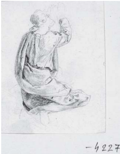
5. Károly Markó, Estudio , lápiz sobre papel, 9.2 × 7.3 cm, Esztergom, Keresztény Múzeum, inv. 4227.

Juan y Cristo, el segundo (fig. 5), la figura con un gabán, rogando, y el tercero (fig. 6), una mujer con su hijo y dos hombres a su lado. Los dibujos son de la última etapa del pintor: a Markó le interesa el asunto de los vestidos, las caras y las extremidades señaladas esquemáticamente. La comparación con las pinturas mexicanas se basa en los detalles de los vestidos, lo mismo que en las expresiones: por una parte, las enaguillas de Cristo, el nudo de la túnica y los pliegues “rodeantes” de los gabanes; por otra, la mano apoyada pensativamente sobre la barbilla, o con un rollo, puesta delante de la cadera, que pueden ser detalles determinantes. Asimismo los dibujos de La transgresión de la ley representan a los tres fariseos interrogando a Jesús (fig. 7), el discípulo escogiendo las semillas (fig. 8), y otro arrodillado delante de su capote (fig. 9). Más detallados son los que figuran el capote del discípulo sentado y su brazo izquierdo (fig. 10), el cuerpo de Cristo vuelto 90 grados hacia la derecha (fig. 11), el busto del discípulo en primer plano, y, en la parte izquierda, pero en la misma hoja, el brazo izquierdo del discípulo en segundo plano (fig. 12). Las diferencias entre los estudios y las obras ejecutadas consisten en las posiciones abiertas o cerradas de las manos, o en la altura de las cabezas —los pliegues siempre son los mismos.