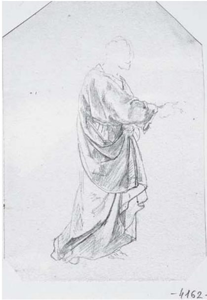
11. Károly Markó, Estudio , lápiz sobre papel, 18.7 × 13.3 cm, Esztergom, Keresztény Múzeum, inv. 4162.

Landesio traiga los cuadros de Markó” 64 pues estaba a punto de embarcarse hacia México pero por fin resultó que “nada pudo llevar consigo”. 65 Un artículo de 1858 es el primero en mencionar la ubicación de El bautismo de Jesús y La transgresión de la ley , “adorna y embellece la galería de originales de la Academia”. 66