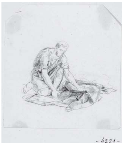
9. Károly Markó, Estudio , lápiz sobre papel, 12.7 × 12 cm, Esztergom, Keresztény Múzeum, inv. 4221.

Roma 58 y hasta diciembre las mandó a O'Brien, 59 unos meses después llegaron examinadas a Francia. 60