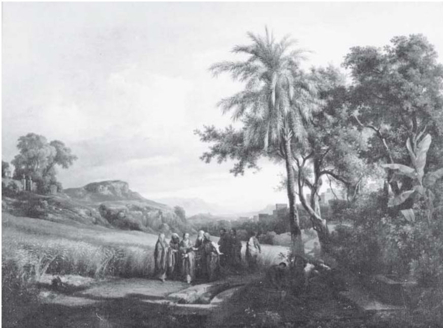
2. Károly Markó, La transgresión de la ley , 1854, óleo sobre tela, con marco: 78.5 × 97.1 cm; sin marco: 53.8 × 71.9 cm, ciudad de México, Museo Nacional de San Carlos, inv. 5406. Reproducción autorizada por el Instituto Nacional de Bellas Artes.

exposición correspondían con los de la carta citada: Jesucristo y los apóstoles , 42 ahora conocido como La transgresión de la ley (fig. 2) y El bautismo de Jesucristo