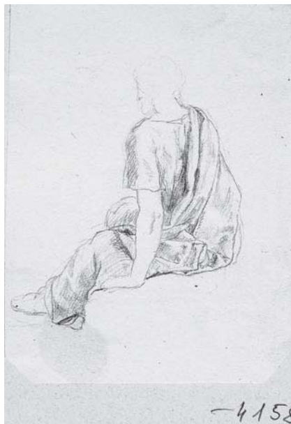
10. Károly Markó, Estudio , lápiz sobre papel, 10.3 × 7.8 cm, Esztergom, Keresztény Múzeum, inv. 4158.

mendada por el pintor y por Larrainzar, 62 pero no disponían de ninguna persona confiable que supervisara el encargo. 63 En principio se proponía que “el mismo