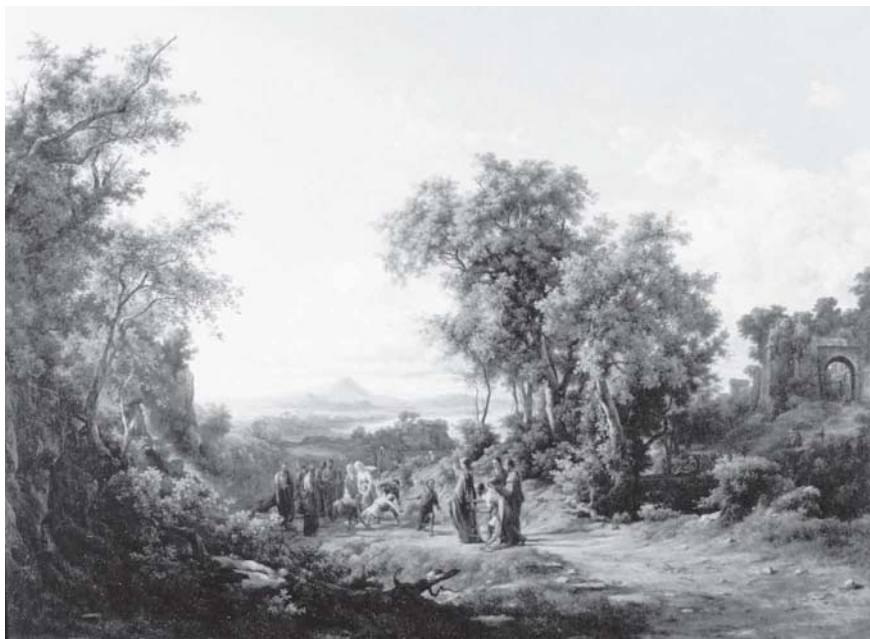
14. Károly Markó, La curación de un endemoniado , 1856, óleo sobre tela, con marco: 143 × 178 cm; sin marco: 106 × 141 cm, ciudad de México, Museo Nacional de San Carlos, inv. 5379.

mejor si hubieran llegado antes de finales de mayo. 73 El mismo autor pudo escribir al presidente de la Academia que el 9 de mayo de 1856 las envió a O'Brien, en París, 74 y en el mes de septiembre que “los cuadros de Markó hace tiempo fueron remitidos” 75 a México. 76 La causa de la demora se oculta en el desmejora-