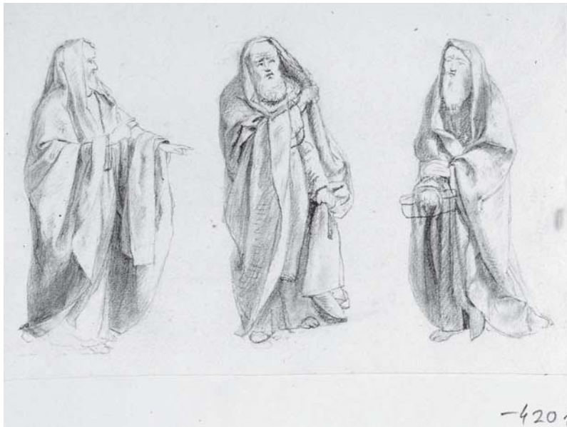
7. Károly Markó, Estudio , lápiz sobre papel, 10 × 14.7 cm, Esztergom, Keresztény Múzeum, inv. 4201.

causó la carta de Viscardini, 49 sino también por algunas “reparaciones arquitectónicas”. 50 Al principio el pintor prometió terminar las obras para los primeros meses del verano, 51 pero según la fechas modificadas ya habrían tenido que estar finalizadas para el 15 o 20 de agosto de 1854. 52 Un documento del Archivo de San