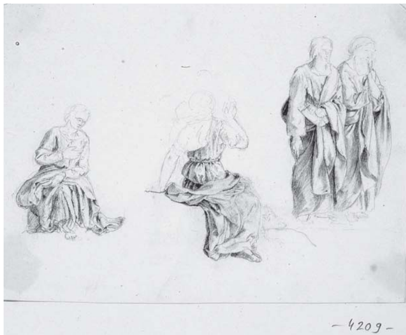
6. Károly Markó, Estudio , lápiz sobre papel, 14 x 18.8 cm, Esztergom, Keresztény Múzeum, inv. 4209.

nado para pintar dos paisajes a través de una carta de Clavé con fecha del primero de febrero de 1854, misma que fue entregada al maestro el 19 de marzo. 47 Son muchos los obstáculos que podemos leer en los documentos: primero una demora en entregar las pinturas a tiempo, 48 no sólo por las equivocaciones que