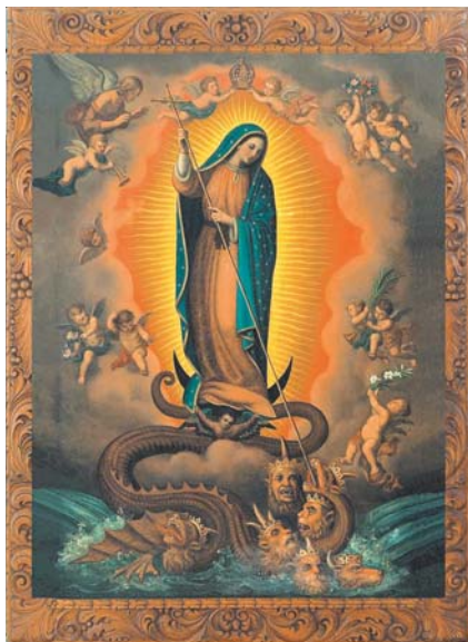
10. Gonzalo Carrasco, La Virgen de Guadalupe venciendo a la bestia apocalíptica , s/f, óleo sobre tela, 150 × 101 cm, tomada de Margarita Hanhausen et al. , La pintura y la palabra. Dos artistas jesuitas mexicanos: Gonzalo Carrasco y Miguel Aguayo , México, Universidad Iberoamericana/Fundación Bustos Barrena SJ, 2005, p. 68. Este cuadro se encuentra actualmente en la residencia jesuita de Puebla.

de cruz (fig. 10). Es significativo que dos de las cabezas de la bestia recuerdan los rasgos de los presidentes Obregón y Calles. 21