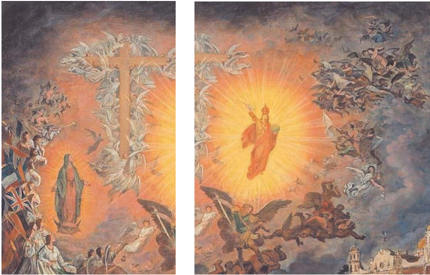
4 y 5. Gonzalo Carrasco, El triunfo de Cristo Rey , óleo sobre tela, sin fecha o firma. Tercio vertical izquierdo y dos tercios verticales derechos, tomados de Margarita Hanhausen et al. , La pintura y la palabra. Dos artistas jesuitas mexicanos: Gonzalo Carrasco y Miguel Aguayo , México, Universidad Iberoamericana/Fundación Bustos Barrena SJ, 2005, p. 25.

La composición presenta dos tercios horizontales de cielo, ocupados por una representación de la Iglesia triunfante y por un tercio terrestre, escenario del devenir de la Iglesia militante. Esta lectura se enriquece con la división vertical de un tercio de colores más sombríos del lado izquierdo por dos tercios luminosos en el centro y la derecha (figs. 4 y 5). Al centro de la pintura, a manera de división, la imagen de la ruina del primer monumento a Cristo Rey en el cerro del Cubilete, Guanajuato, demolido por órdenes del general Amaro en enero de 1928, durante la etapa más severa del conflicto.