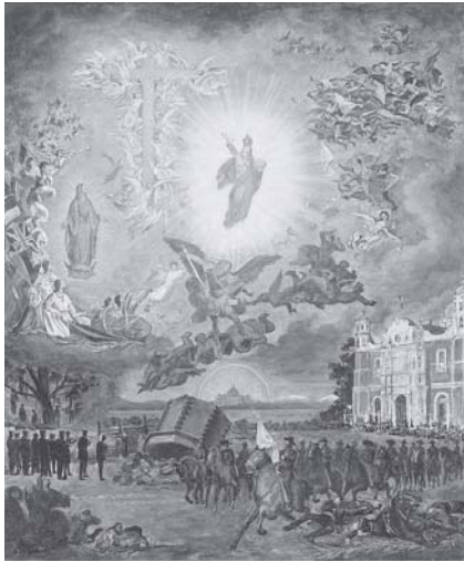
1. Gonzalo Carrasco, El triunfo de Cristo Rey , óleo sobre tela, sin fecha o firma, tomada de Margarita Hanhausen et al. , La pintura y la palabra. Dos artistas jesuitas mexicanos: Gonzalo Carrasco y Miguel Aguayo , México, Universidad Iberoamericana/Fundación Bustos Barrena SJ, 2005, p. 25. Actualmente la imagen se encuentra en la residencia jesuita de la calle de Enrico Martínez núm. 9, centro histórico, ciudad de México. Reproducción autorizada por la Provincia Mexicana de la Compañía de Jesús.

cieran cerradas, indicando que aún no se habían llevado a cabo las pláticas entre el gobierno y la Iglesia católica mexicana que en 1930 permitirían la reapertura de los templos.