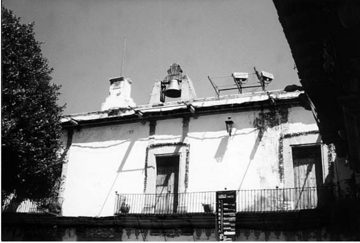
1. Casa Borda, Taxco, Guerrero, México.