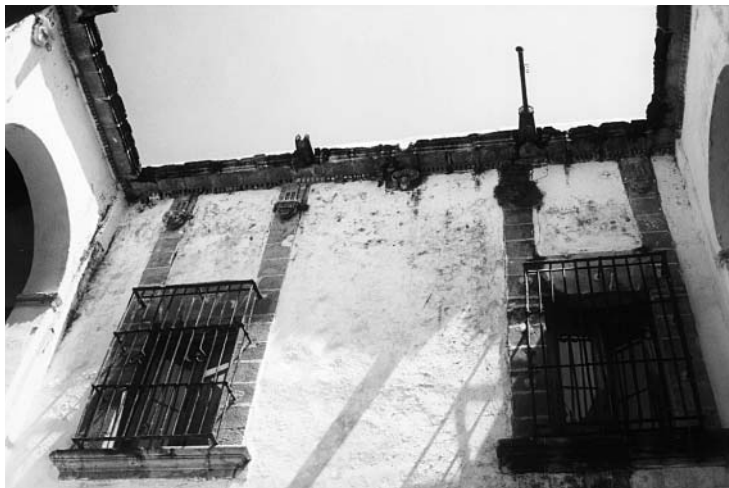
3. Casa Borda, Taxco, Guerrero, México.