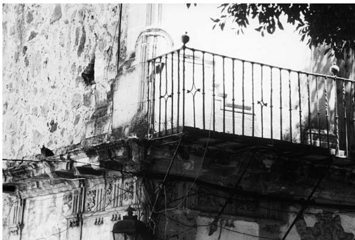
2. Casa Borda, Taxco, Guerrero, México.

Fue Manuel Toussaint, en su libro sobre Taxco, 6 el primero en ocuparse de dicha casa y llamar la atención sobre su extraordinaria estructura, ya que el conjunto de las dos casas tiene dos pisos por la fachada principal que da a la Plaza Borda y cinco niveles en su parte posterior, para ajustarse al gran desnivel del terreno donde está asentada. Esta solución tan osada es, sin duda, uno de los mayores logros de su arquitecto.