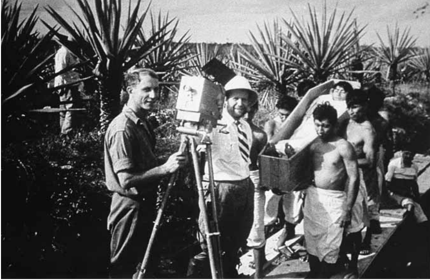
Figura 1. En la filmación del episodio inspirado en la obra Entierro de un obrero , de David Alfaro Siqueiros.

Marie Seton, en Eisenstein había surgido una nueva pasión: la de recopilar información publicada por periódicos y revistas sobre él mismo, material custodiado en la actualidad por el Archivo Estatal de Literatura y Arte de Moscú 32 y en su museo.