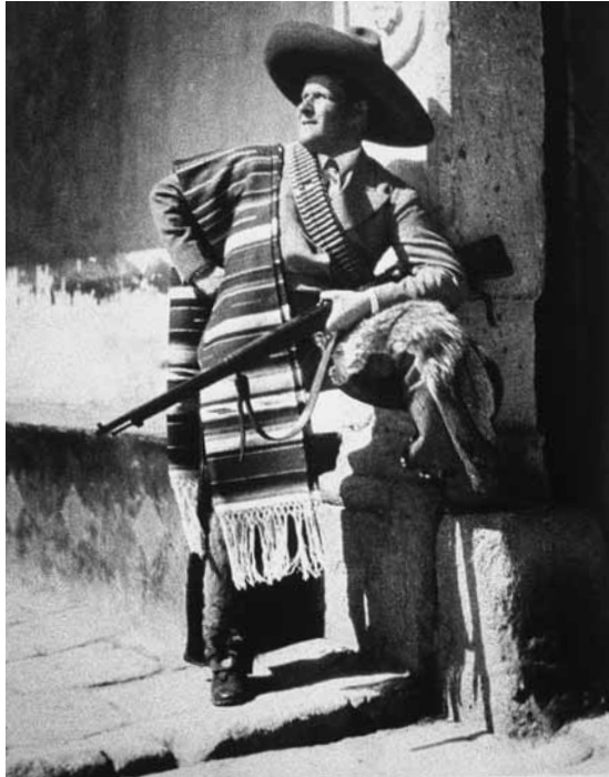
Figura 3. México cobijó a Eisenstein.

se suceden, diferentes en carácter, en gentes, animales, árboles y flores. Y, sin embargo, unidos entre sí por la unidad de la trama: una construcción rítmica y musical y un despliegue del espíritu y el carácter mexicanos. 65