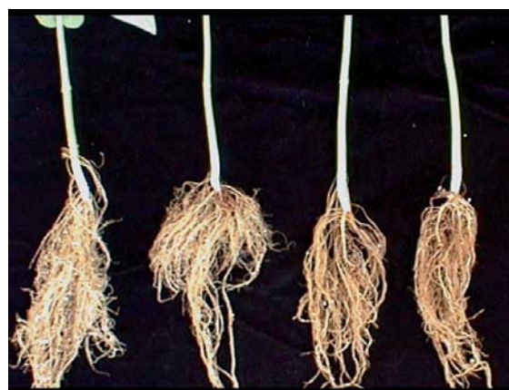
Figura 4. Síntomas causados por Fusarium solani sobre la variedad Montcalm a los 21 días de la inoculación. Planta del lado izquierdo sin inocular, tres plantas inoculadas del lado derecho. Observe la ausencia de lesiones extendidas sobre el hipocotilo.