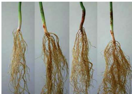
Figura 2. Síntomas de Fusarium lateritium sobre la variedad Montcalm a los 14 días de la inoculación. Planta del lado izquierdo sin inocular, tres plantas inoculadas del lado derecho.

A los siete días después de la inoculación, las raíces secundarias de las plantas inoculadas mostraron un cambio de coloración de claro a café rojizo, comparado con el control sin inocular. Lesiones similares han sido reportadas para F. semitectum (Dhingra y Muchovej, 1979) y F. solani (Bolkan, 1980) sobre frijol. Dhingra y Muchovej (1979) indicaron que