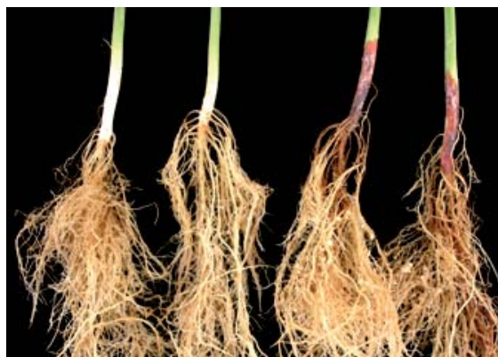
Figura 3. Síntomas de Fusarium lateritium sobre la variedad Montcalm a los 14 días de la inoculación. Planta del lado izquierdo sin inocular, tres plantas inoculadas del lado derecho.

las lesiones causadas por F. semitectum son similares a las causadas por Rhizoctonia solani ; sin embargo, los síntomas causados por este hongo se diferencian claramente de los daños causados por F. lateritium sobre frijol. Aunque la descripción de síntomas sobre el hipocotilo y la raíz principal causados por F. solani es similar a los síntomas causados por F. lateritium , las dos cepas de F. solani utilizadas no causaron síntomas confundibles al nivel del hipocotilo entre las dos especies sobre la variedad Montcalm (Figura 4), la cual fue reportada como susceptible a F. solani por Schneider y Kelly (2000).