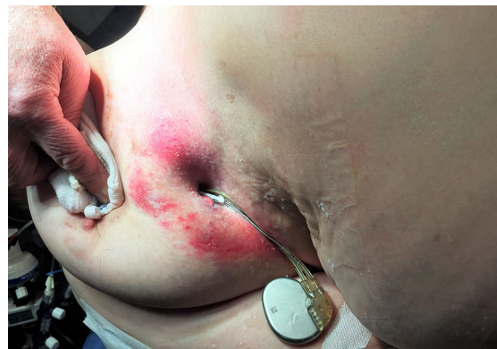
Figura 1 Generador y electrodos del marcapasos, surgiendo a través del surco submamario derecho.

Presentamos el caso de una mujer de 80 años, con antecedentes de diabetes mellitus tipo 2 e hipertensión arterial controladas adecuadamente, portadora de marcapasos (MP) bicameral en modo DDD debido a bloqueo auriculoventricular completo hace 12 años. Actualmente, acude al observar un cuerpo extraño en el surco submamario derecho, lugar donde había recibido tratamiento previo con antimicóticos tópicos por presentar signos inflamatorios con sospecha de micosis, sin realizar control del MP. Al momento de la consulta se encontraba normotensa, afebril, y con una frecuencia cardíaca de 60 lpm debido a estimulación permanente de su MP, con ritmo sinusal basal. Al examen se objetivó el generador extruido a través del surco descrito, evidenciándose adecuada conexión con los electrodos (fig. 1). La radiografía de tórax mostraba el MP fuera de la cavidad torácica, con electrodos adecuadamente ubicados en aurícula y ventrículo derechos (fig. 2). Dada la contaminación del sistema, se realizó tratamiento