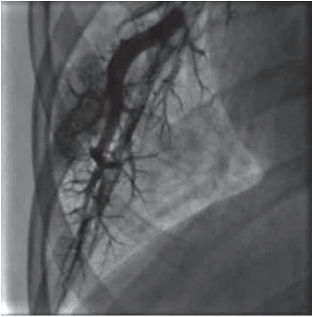
Figura 5 Angiografía pulmonar magnificada en cuña de la rama izquierda. Se observa la mancha capilar heterogénea con amputación de algunos vasos arteriales, en un paciente con anomalía de Ebstein e hipertensión arterial pulmonar.

lar pulmonar. Se le realizaron un ecocardiograma en modo M que mostró una interrupción septoauricular y un cateterismo cardíaco que demostró una presión sistólica de la arteria pulmonar de 83 mmHg (media de 47,8 mmHg). El índice de resistencia pulmonar total fue de 3,47 U Wood.