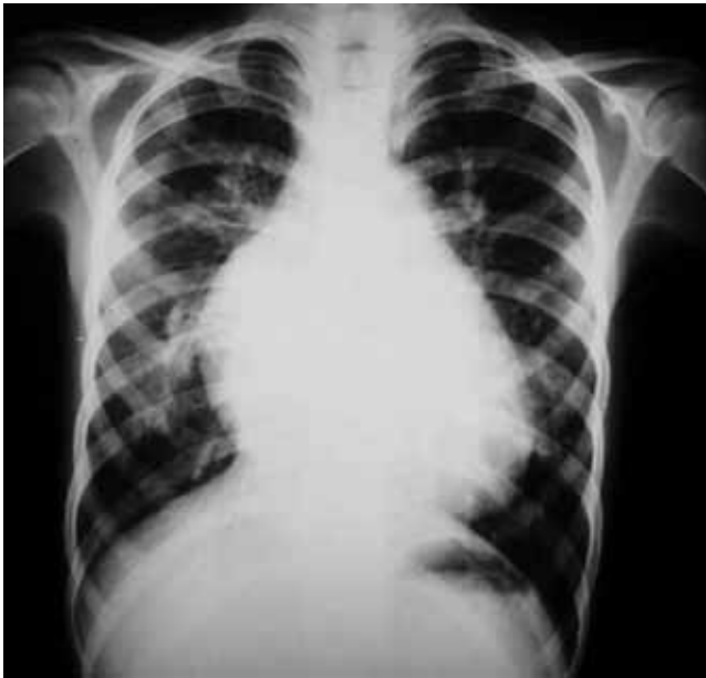
Figura 1 Radiografía de tórax posteroanterior de paciente con anomalía de Ebstein y comunicación interventricular. Se observa una cardiomegalia principalmente a expensas de la silueta de la aurícula derecha, abombamiento del tronco de la arteria pulmonar y aumento de la trama vascular pulmonar.

Paciente varón de 27 años, con historia de fallo cardíaco desde los primeros meses de vida. Estudiado en 1981, en la radiografía de tórax se observó una cardiomegalia con crecimiento de cavidades derechas y aumento de la trama vascular