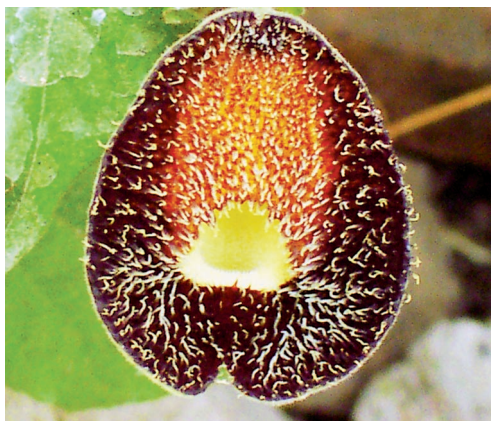
Fig. 2. Aristolochia manantlanensis , detalle del limbo.

4-8 (10) mm de largo y 1 mm de grueso, bractéolas triangular-cordadas, pilosas, de (4) 5-10 (11) mm de largo, 4-7 (9) mm de ancho; la parte basal del cáliz forma un ángulo de 180^\circ respecto a la apical, purpúrea, la garganta glabra, amarilla, hipantio no evidente, limbo ovado-cordado, peltado en la antesis, entero, el ápice obtuso, de 2.4-2.8 cm de largo, 1.7-2.4 cm de ancho, de color púrpura oscuro con una línea verde amarillenta, abundantemente piloso-fimbriado, excepto en la garganta, los tricomas de 0.7-1 mm de largo, tubo tubular con la parte basal adpresa a la apical ( 180^\circ ), de color verde a purpúreo, de (1.7) 1.9-2.2 (2.5) cm de largo, 4-5 mm de diámetro, con tricomas esparcidos, utrículo oblongo-elipsoide, esparcidamente piloso, de 9-11 mm de largo, 5-6 mm de diámetro, siringe excéntrica, tubular, de 2-2.5 mm de largo, 2 mm de diámetro; ginostemo 5-lobado, subestipitado, de 3 mm largo, 2 mm de diámetro, estípites de 1.5 mm de largo, 1.5 mm de diámetro, estambres 5, tetraloculares, anteras de 1.5 mm de largo, 0.25 mm de ancho; ovario algo piloso, de 9-11 (12) mm de largo, 2-2.5 mm de diámetro; fruto capsular, botuliforme, dehiscencia basicaida, septífrega, de 2-2.7 cm de largo, 1.5-1.7 cm de diámetro; semillas numerosas, triangulares, de color café obscuro, de 5-6 mm de largo, 5-6 mm de ancho, 1 mm de grueso, la superficie ligeramente tuberculada.