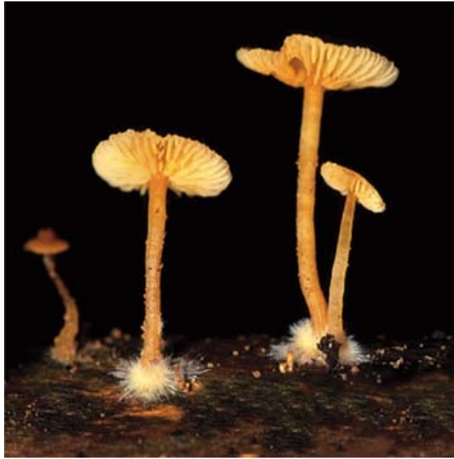
Fig. 2. Basidiomas de Gymnopilus tuxtensis en la región de El Tuito, Jalisco.

Venezuela, Estado Guarico, aprox. 45 km S-SW de Calabozo, Fondo Pecuario Masaguaral, agosto 3, 1980, C. Ovrebo 1182-A (F); agosto 17, 1980, C. Ovrebo 1215-A (F-1059160).