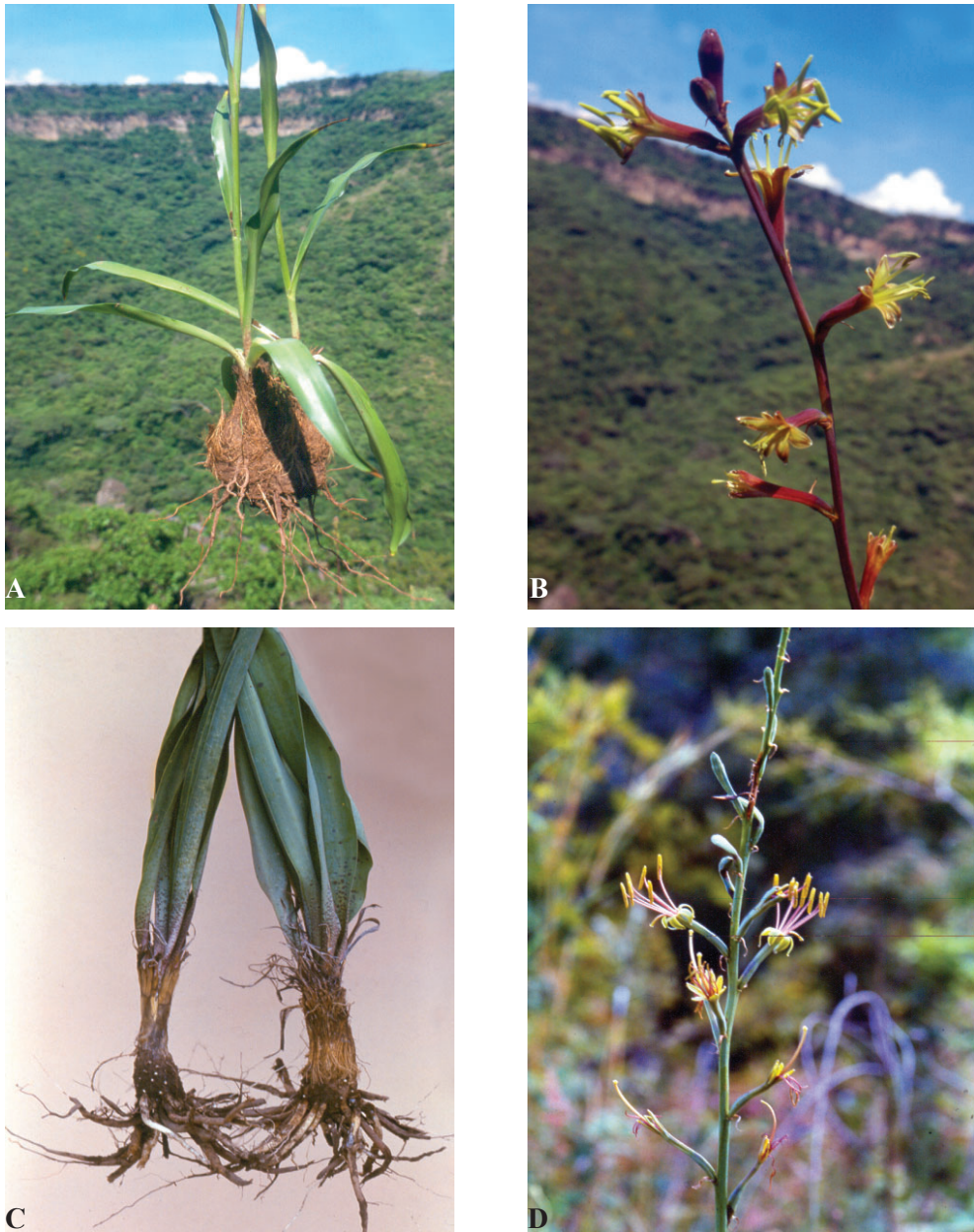
Fig. 3. A y B. Manfreda galvaniae : A. Cormos y hojas; B. Inflorescencia. C. Cormos de M. scabra (izquierda) y M. galvaniae (derecha); D. Inflorescencia de M. scabra . (A y B, del número AG-6624; C izquierda y D, del número AG-6084; C derecha, del número AG-6085. Todas las fotos de la barranca de Malinaltenango.