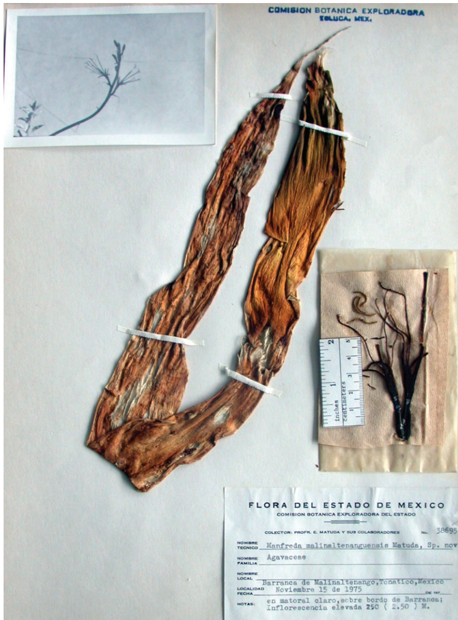
Fig. 2. Manfreda malinaltenangensis Matuda. Tipo: México. Estado de México, (municipio de Ixtapan de la Sal), barranca de Malinaltenango, 15 noviembre 1975, E. Matuda 38695 (lectotipo: CODAGEM).