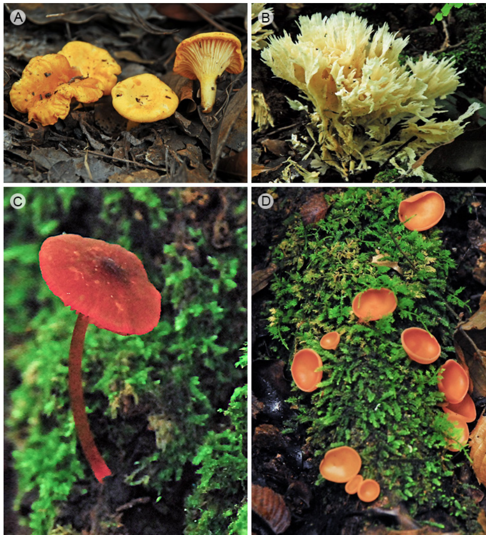
Figura 2: A. Cantharellus cibarius Fr.; B. Hydnopolyporus palmatus (Hook.) O. Fidalgo; C. Pluteus horakianus Rodr.-Alcánt.; D. Cookeina venezuelae (Berk. & M.A. Curtis) Le Gal.

Ascomycota (Cuadro 1), y se adscriben 16 órdenes del primero y cuatro del segundo. Dentro de Basidiomycota, Agaricales fue el orden mejor representado con 93 taxones, seguido por Polyporales (69), Boletales (35), Russulales (26) e Hymenochaetales (19) como puede verse en el Apéndice 1. También se muestran las 10 familias mejor representadas: Polyporaceae (42), Amanitaceae (19 especies, 1 forma y 3 variedades) (23), Boletaceae (20), Hymenochaetaceae (17), Russulaceae (12), Fomitopsidaceae (9), Pluteaceae y Stereaceae (8), Strophariaceae (7) y Pleurotaceae (6 especies y 1 variedad). De los 26 registros de Ascomycota distribuidos en cuatro órdenes, los mejor representados fueron los Pezizales (11) y Xylariales (9). De las familias registradas en esta división, las más diversas fueron Helvellaceae e Hypoxylaceae (5),